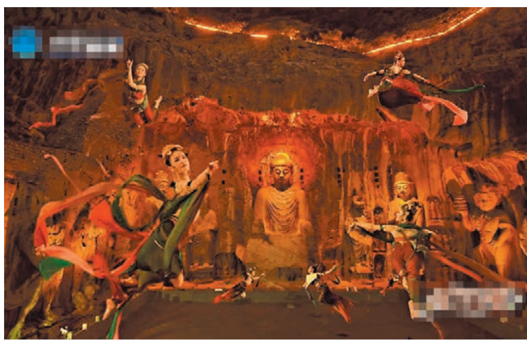
●「飛天」姿態輕盈優美。

據路紅莉介紹,整個節目希望達到的效果,是讓千年石刻在當代人心「活」起來。為此,節目組選擇了「虛實相生」的方案,部分鏡頭嚴格遵守《文物保護法》的相關規定,在龍門石窟