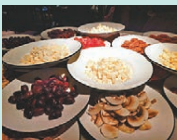
●平時注重飲食營養，食材宜時令、新鮮而多樣，避免食用有興奮性和刺激性的飲料和食物。

在日常護理方面，對多動症學童需時刻關心與體諒，對其行為及學習進行耐心的幫助與訓練，宜循序漸進；進行個性化教育，注重激勵，配合心理輔導，對適應性反應（專注力、情緒控制、身體協調能力、動作計劃能力、組織能力及自信）欠佳的學童可進行感覺統合訓練；多加關注其行為，預防攻擊性、破壞性及危險性行為的發生。平時注重飲食營養，總要以「調和陰陽、調暢氣血、安神定志」為原則，避免食用有興奮性和刺激性的飲料和食物，積極尋求註冊中醫的協助，務求從辨識體質入手，實踐度身訂做的養生防病方案。