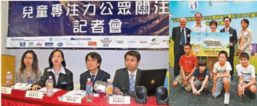
●協康會及專注不足/過度活躍症（香港）協會，均對多動症有相當的關注。