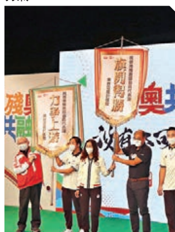
●港台昨日舉行「殘奧共融睇沒有不可能」打氣大會，為一眾港將打氣。