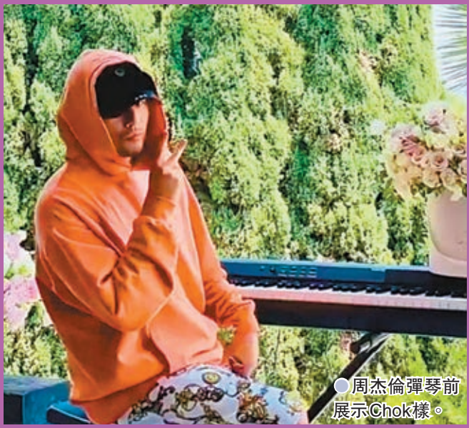
●周董彈琴前展示Chok樣。