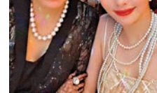
●邱淑貞與女兒長得像姊妹。