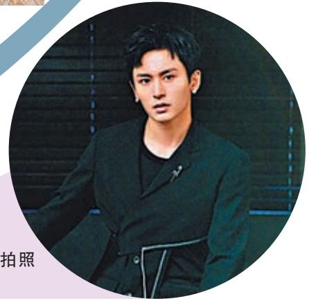
●張哲瀚已就拍照事件公開道歉。