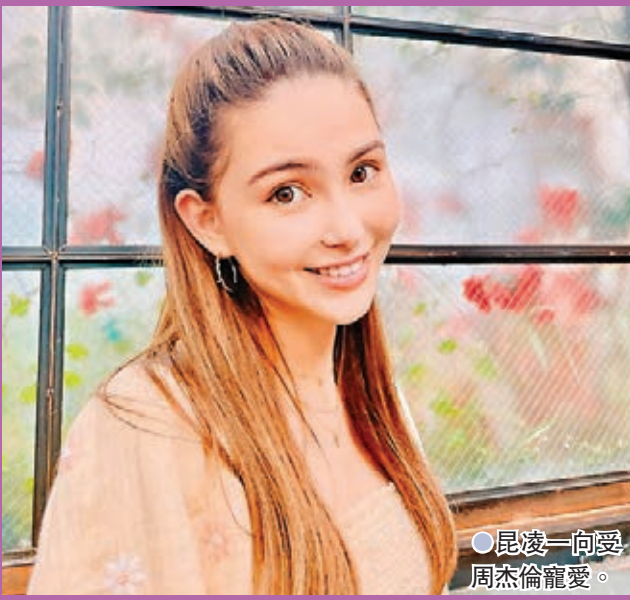
●昆凌一向愛周杰倫寵愛。