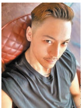
●陳偉霆出道以來緋聞不斷，桃花極旺。