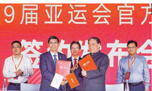
杭州亞組委與娃哈哈簽署贊助合約。