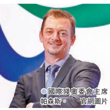
國際殘奧委會主席帕森斯。官圖圖片

望東京殘奧會能起到劃時代的作用。 參加本屆殘奧會的運動員大約有4,400人，來自約160個國家和地區。帕森斯本人將於16日抵達日本，奧運村經過略微改造後將作為殘奧村在17日正式開放。 截至13日，日本全國單日新增新冠確診病例數首次超過2萬人，東京都新增新冠確診病例5,773例，創下歷史新高。 ●新華社