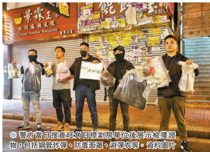
●警方當日搜查旺角目標劊房單位後展示檢獲證物，包括鋼管炸彈、防毒面罩、避彈衣等。資料圖片

法官謝沈智慧昨日在判刑時指，本案罪行嚴重，案發於社會動盪不安之際，被告行為對公眾安全構成嚴重威脅，涉案喉管炸彈屬自製爆炸物品，並不穩定，其爆炸熱力可波及1米範圍，碎片效應更可波及至50米範圍，置之於全港最繁忙、人口最稠密的旺角區一劊房內，連同高易燃物品一同保存，一旦發生意外，可引致嚴重受傷及死亡。事實上，在警方爆炸品處理課人員引爆該炸彈後，現場有升降機金屬門損毀。 謝官認為，雖然本案無直接證據顯示爆炸品用途，但幾可肯定用以「為非作歹」，而在涉案單位同時發現大量常見於黑暴分子示威的裝備，包括多個頭盔、防毒面具、手套、全黑衣物等，可見該爆炸品非常可