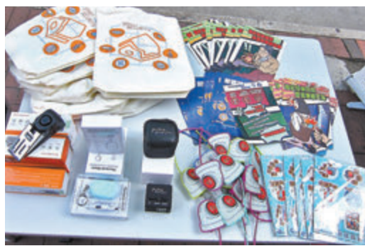
▲推廣車擺設攤位展示「電子警報門楔」、防狼器等(上圖)，車內亦擺放防盜感應器(左圖)。

香港文匯報訊(記者 蕭景源)今年首6個月，香港整體罪案總數較去年同期下跌，但涉村屋及居屋爆竊案大幅上升。為進一步提高市民對打劫、爆竊及搵快錢罪行的警覺性，警方將8月定為「安居樂月」，舉辦「安居樂月」推廣車、防罪微影片及防罪WhatsApp Sticker連串宣傳活動，希望藉此與社區一同推廣「全城防罪防盜」。 防止罪案科警司李志文昨日出席「安居樂月」活動時表示，今年首6個月，本港整體罪案總數為30,871宗，較去年同期32,345宗減少1,474宗，下跌4.6%。修例風波完結後，警員返回前線巡邏及