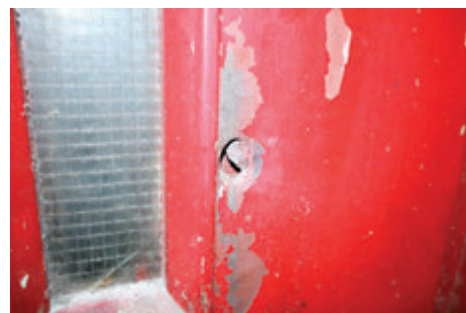
▲警方當日發現鋼管炸彈(左圖)，即場引爆後，大廈升降機門被碎片擊穿(上圖)。

能用於示威之中。被告同時還涉及大麻毒品，與求情信所指他「負責任」及「關心他人」說法不符。