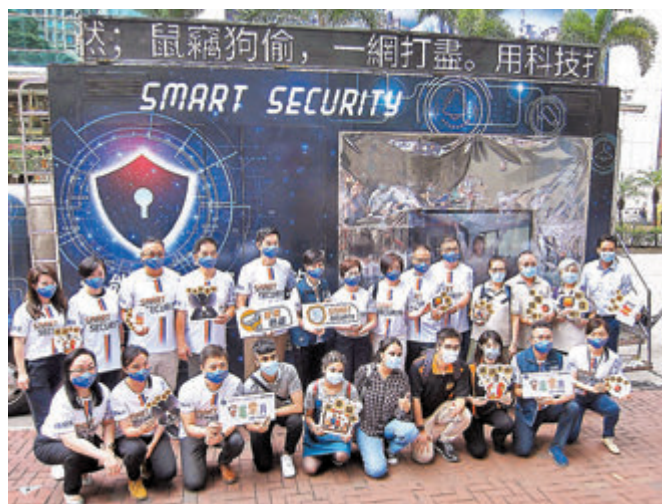
●警方「安居樂月」推廣車昨日停泊在灣仔修頓中心外，宣傳「全城防罪防盜」。