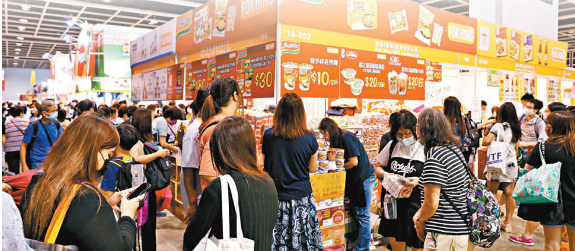
●即食麵參展攤檔深受市民歡迎，市民趁最後一天入貨。