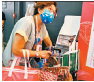
●蘇女士與兩名友人一同入場掃貨，共花費三四千元買了一些補品、海味、即食麵等日常食材。