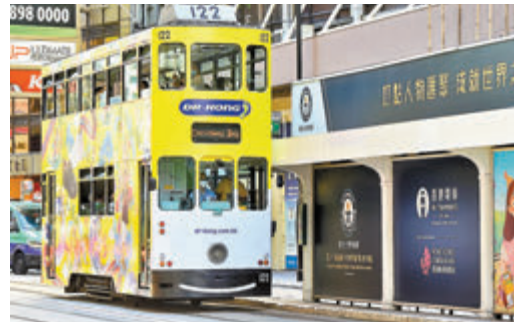
●中環一電車站廣告牌上寫着「最大的服務中的雙層電車車隊」。

香港文匯報訊(記者 文森)電車公司獲健力士世界紀錄確認為全世界「最大的服務中的雙層電車車隊」，適逢香港運動員在東京奧運會創下佳績，電車公司昨日宣布，將舉辦首次由電車公司自行承擔的免費乘車日，與全港市民一同慶祝這個歡樂時刻。