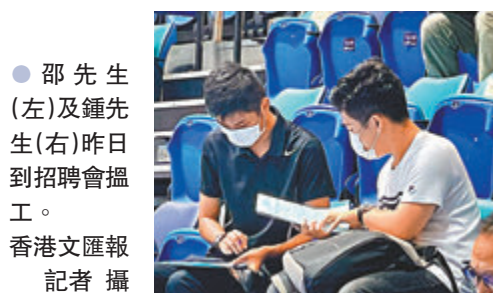
●邵先生(左)及鍾先生(右)昨日到招聘會搵工。