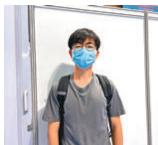
●譚先生表示，打算應徵一些文職工作累積經驗。