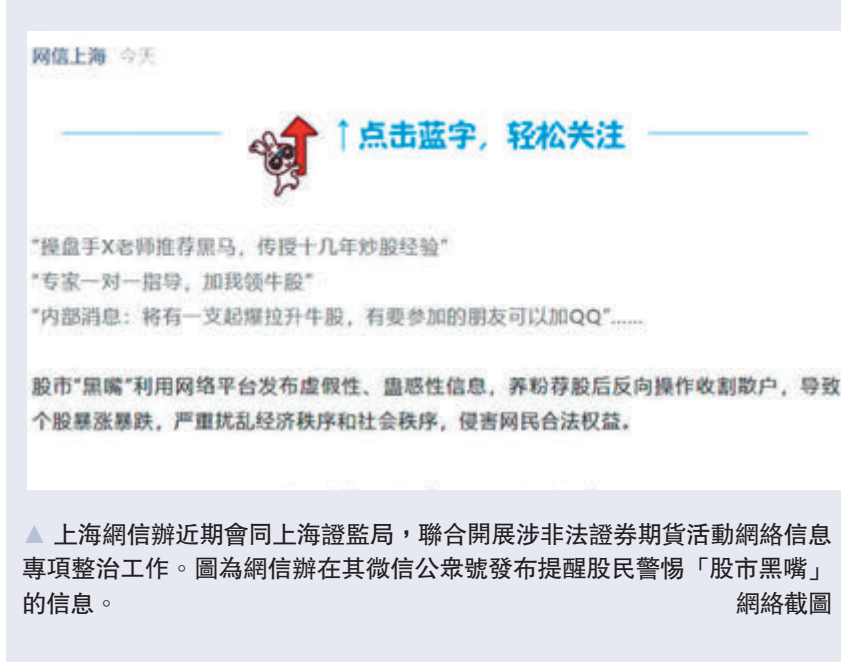
▲上海網信辦近期會同上海證監局，聯合開展涉非法證券期貨活動網絡信息專項整治工作。圖為網信辦在其徵信公眾號發布提醒股民警惕「股市黑嘴」網絡截圖。