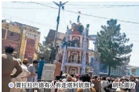
●賈拉拉巴德有人拆走塔利班旗。

雖然塔利班控制阿富汗的大局已定，但部分原政府官員仍然試圖抵抗。原阿富汗政府第一副總統薩利赫前日宣布，在原總統加尼棄國而去後，按憲法應由他接任「臨時總統」，並呼籲阿富汗人繼續抵抗塔利班。俄羅斯傳媒引述消息指，薩利赫麾下部隊在地方軍閥協助下，前日從塔利班手中奪回北部一個省會城市，並正與塔利班激戰，不過專家認為薩利赫翻盤的機會「很小」。