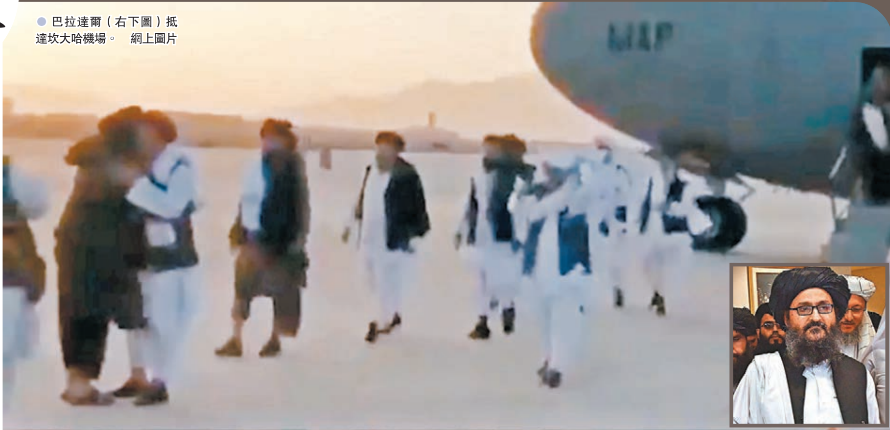
●巴拉達爾(右下圖)抵達坎大哈機場。

阿富汗塔利班控制首都喀布爾後，外界關注新政府會如何組成。塔利班創辦人之一、二號人物巴拉達爾在流亡近20年後，前日高調返回阿富汗，被視為可能為出任新政府領袖作準備。塔利班發言人前日舉行記者會，承諾組建具包容性的政府、保護女性權益、赦免曾為外國政府工作的人員等。西方國家則繼續加緊撤僑，華府表示塔利班承諾提供通往喀布爾機場的「安全通道」，供平民撤離。