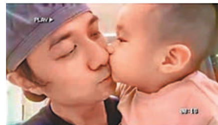
●古巨基珍重仔仔的獻吻。