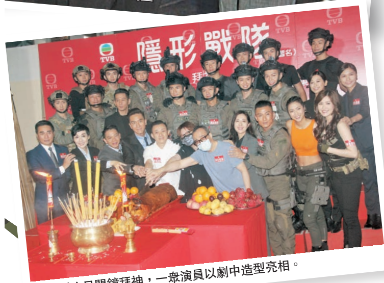
●新劇昨日開鏡拜神,一眾演員以劇中造型亮相。