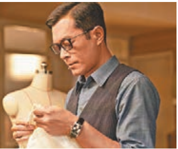
●古天樂飾演梅艷芳摯友Eddie。