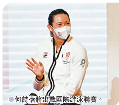
●何詩蓓將出戰國際游泳聯賽。

於東京奧運勇奪兩面銀牌的何詩蓓獲頒發500萬港幣與張家朗一同榮膺「獎金王」，接下來稍作休息後將會出戰國際游泳聯賽，她強調能在奧運取得佳績是結合多方面的共同努力，並再次感謝全港市民的支持：「我在電視上看到有很多市民在商場看我比賽，社交網站上亦收到很多支持，雖然我未能逐一回覆，但每一個市民的支持都是推動我進步的力量。」縱使已成為世界頂尖泳手，何詩蓓仍不改一貫的謙虛作風，表示未有想過下屆巴黎奧運的事情，會專注在每次訓練及每場比賽之上，而至於會否以打破世界紀錄為目標，她則表示：「世界紀錄總會有被打破的一日，而獎牌則是永遠，我會更想在奧運拿到獎牌，不過挑戰自己繼續進步才最重要。」