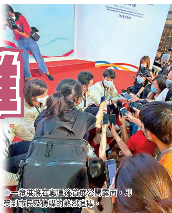
一眾港將在奧運後首度公開露面，即受到市民及傳媒的熱烈追捧。