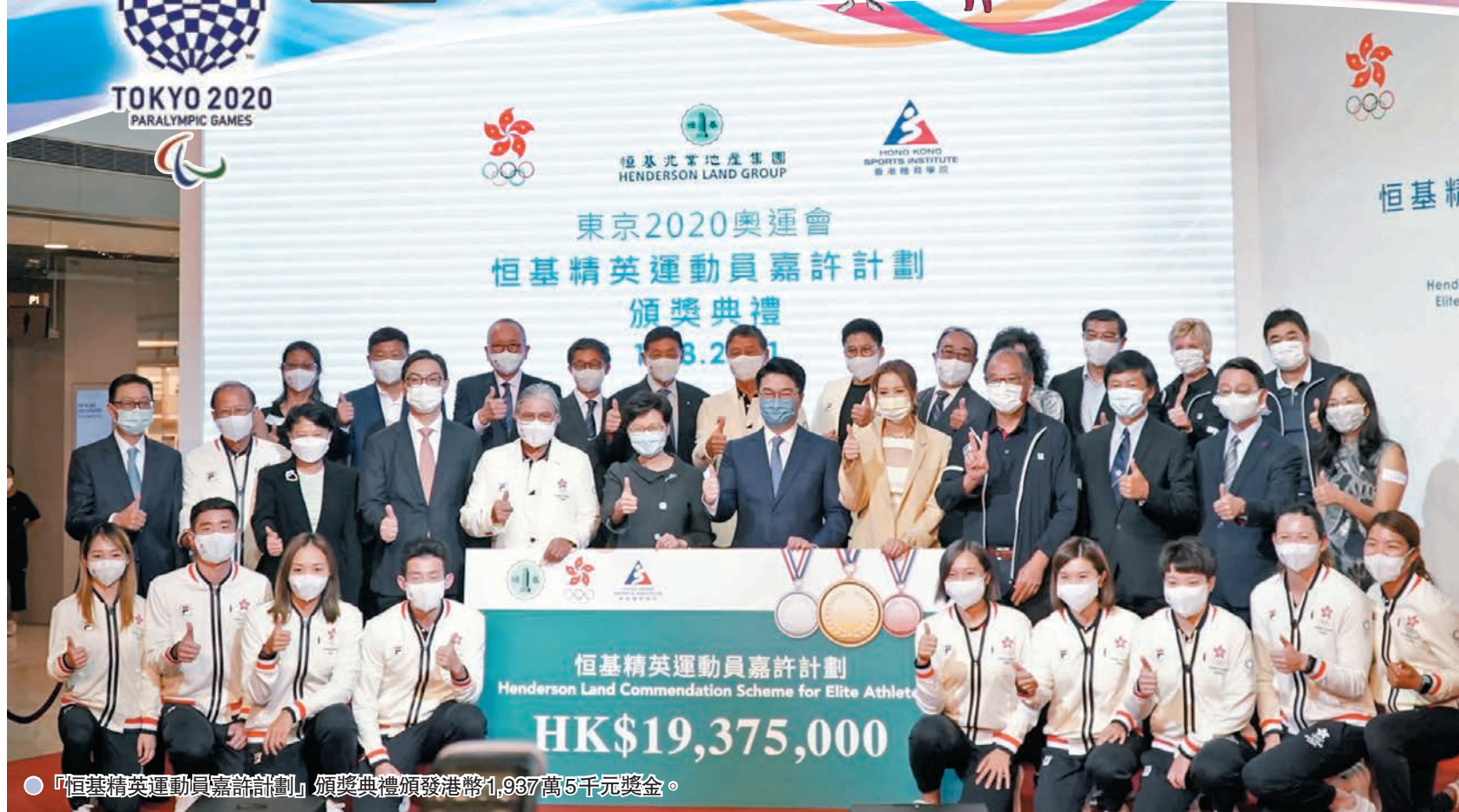
「恒基精英運動員嘉許計劃」頒獎典禮頒發港幣1,937萬5千元獎金。

東京奧運後體育狂熱席捲全城，昨日一班港隊成員出席「恒基精英運動員嘉許計劃」頒獎典禮受到市民及傳媒的熱烈追捧，在過百名支持者掌聲下接受破紀錄的港幣1,937萬5千元獎金。奧運後首度公開露面即面對前所未有的「墟冚」情景，一眾香港奧運代表坦言要時間適應，但亦一致認為對香港體壇有