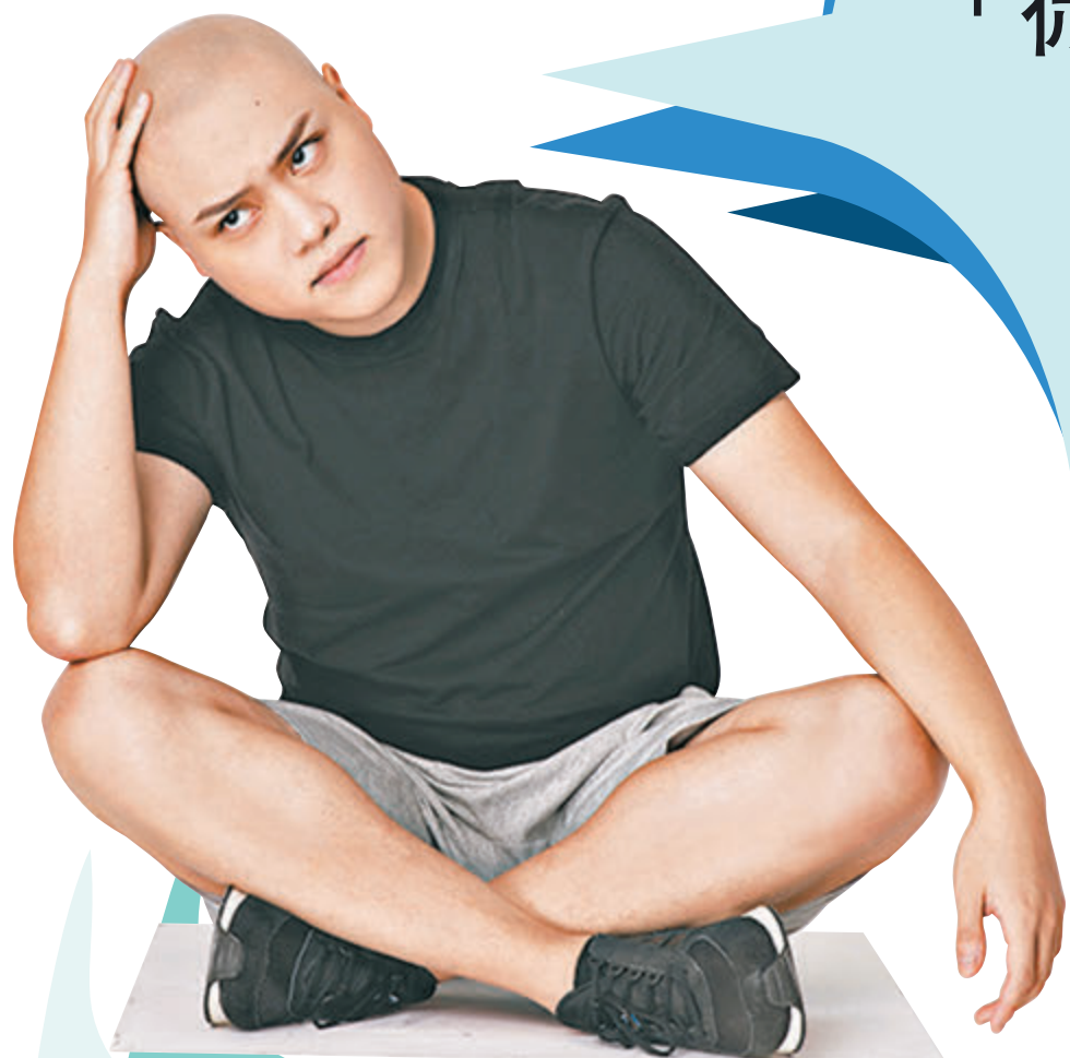
●六毫子認為自己是一個被商業耽誤的藝術家。