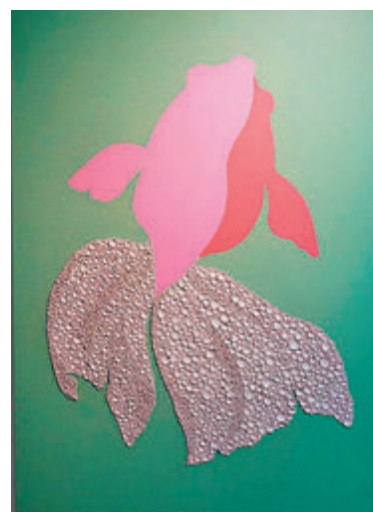
●製作《金魚》時，藝術家的靈感不斷衍生。