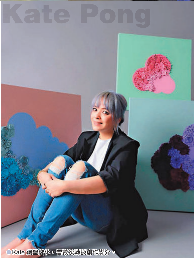
●Kate渴望變化，曾數次轉換創作媒介。