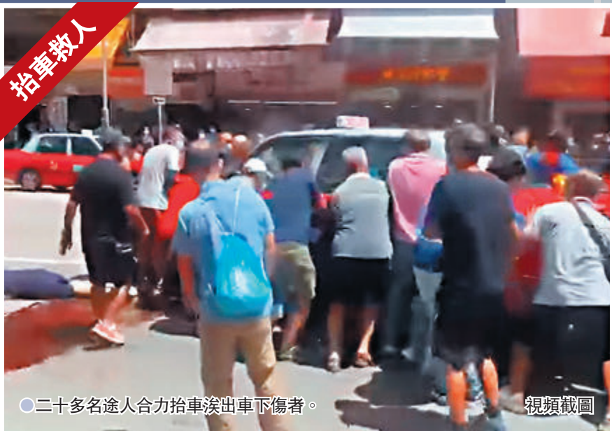
二十多名途人合力抬車滾出車下傷者。 視頻截圖

現場為廣福道近102號寶基樓對開、往寶鄉路方向的燈位。事發在昨日上午11時21分，當時車路交通燈已轉為紅燈，行人斑馬線則亮起綠燈，大批行人開始橫過馬路。據停在逆線燈位前一輛的士的車頭車Cam片段顯示，對面已有一輛白色私家車停下，尾隨一輛綠色的士駛近亦減速，惟第三輛紅色的士並無減速停車，而是向右扭軚越過路中雙白線，直剷上路中安全島，撞塌一支交通燈柱，再如打保齡球般碾過人羣，發出連串駭人的「嘍嘍」聲。多名途人被捲入車底或輾過。攝下片段的的士司機驚呼大呼：「慘喇！點解會咁嘍？」