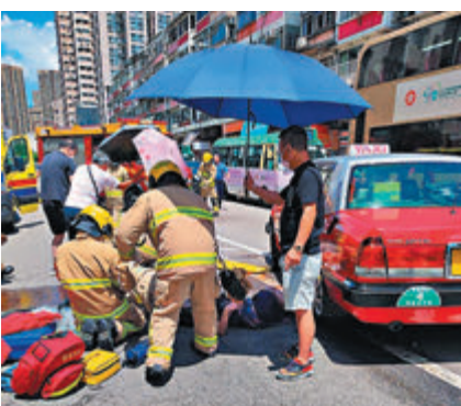
消防及救護員為傷者包紮時，熱心市民替其打傘遮陽。 視頻截圖