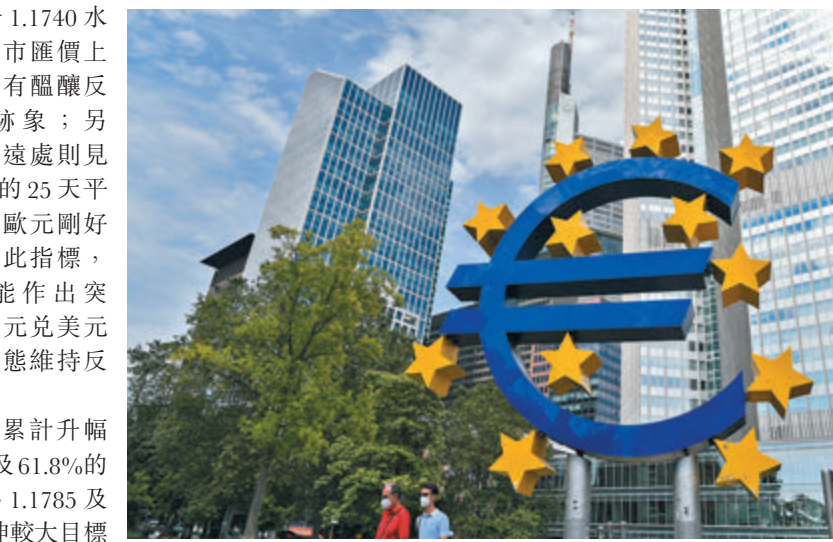
圖為人們從位於德國法蘭克福的歐元雕塑前走過。

歐元兌美元升上1.1720水平上方,脫離上周五觸及的九個月半月低點1.1662美元。圖表見上週五觸及的九個月半月低點1.1662美元。圖表見上週五觸及的九個月半月低點1.1662美元。圖表見上週五觸及的九個月半月低點1.1662美元。