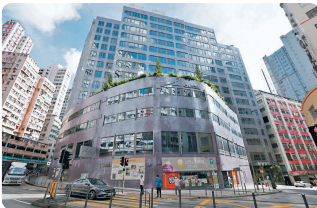
●特區政府擬要求外傭抵港後在兩間指定酒店檢疫21天，已暫時選定荃灣絲麗酒店為其中一間專接收外傭的酒店。圖為荃灣絲麗酒店。

傭分批有序來港，避免他們同一時間入境，以免對本港醫療系統造成壓力，若同時提供多間特定檢疫酒店供外傭預訂，便不符合逐步有序來港的原則，望已聘請外傭的僱主諒解。