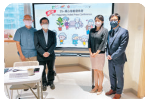
●「香港開心D」調查發現，初老長者在疫情期間的開心指數有明顯下跌跡象。

受訪者對「整體經濟狀況」及「居住環境和住房狀況」的評分有明顯下跌趨勢，分別由4.95分跌至4.43分，以及5.47分跌至4.98分。白雪表示，55歲至64歲人士普遍「上有高堂，下有兒女」，成為夾心階層，須負起家庭重擔，惟疫情期間，居家工作或學習成為常態，增加他們負擔，加上他們退休在即，加上不少公司在疫情期間裁員或調整上班模式，導