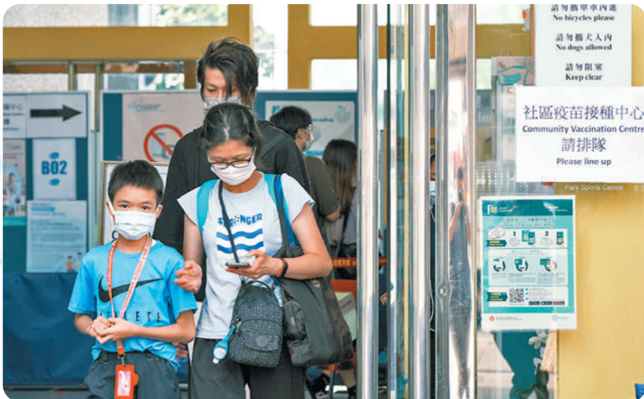
●林鄭月娥宣布，12歲或以上學生將可透過「即日籌」，毋須預約便可到社區疫苗接種中心接種疫苗。圖為家長陪同小朋友到中山紀念公園體育館社區疫苗接種中心接種新冠疫苗。

香港文匯報訊（記者文森）香港新冠疫苗接種計劃展開至昨日已是第一百八十天，昨日近5.7萬人接種疫苗和約1.15萬人預約接種時間，令累積總接種劑次高達717萬，其中398.3萬人已接種最少一劑疫苗。截至昨日零時零分，過去24小時共有17宗由社區疫苗接種中心或醫院管理局轄下的指定普通科門診診所送院的個案，他們因接種後出現常見副作用而送院，情況穩定，其中12人已經出院，4人留院觀察，一人未經診症自行離開醫院。