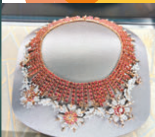
●Jean Schlumberger 系列