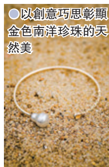
●以創意巧思彰顯金色南洋珍珠的天然美