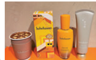
●由即日起至9月16日, 於雪花秀門市或網店購買1支潤燥再生精華, 送鎖草毛孔淨緻白泥面膜, 同時獲得 Amber House 期間限定 Orange Latte 換領券乙張。

今年, 上環太平山街隱世咖啡店 stain+ 為雪花秀打造期間限定 First Care 夏日別注咖啡店 Amber House, 以慶祝特別為今個盛夏推出的潤燥再生精華夏日別注版 First Care Activating Serum Summer Edition (別名 Orange Latte), 品牌更特別聯同本地生活創作品牌 BIKUTA MALAMIA 注入玩味新鮮感, 為外牆創作了巨型壁畫, 讓你走進炫目耀眼的雪花秀世界。大眾除了可以到訪打卡熱點外, 也能夠細意品嚐 stain+ 特別沖調香濃綿滑的 Orange Latte, 過一個悠閒寫意的下午。