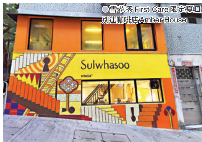
●雪花秀 First Care 限定夏日別注咖啡店 Amber House

今年, 上環太平山街隱世咖啡店 stain+ 為雪花秀打造期間限定 First Care 夏日別注咖啡店 Amber House, 以慶祝特別為今個盛夏推出的潤燥再生精華夏日別注版 First Care Activating Serum Summer Edition (別名 Orange Latte), 品牌更特別聯同本地生活創作品牌 BIKUTA MALAMIA 注入玩味新鮮感, 為外牆創作了巨型壁畫, 讓你走進炫目耀眼的雪花秀世界。大眾除了可以到訪打卡熱點外, 也能夠細意品嚐 stain+ 特別沖調香濃綿滑的 Orange Latte, 過一個悠閒寫意的下午。