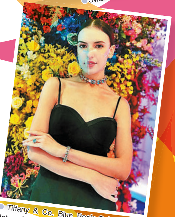
●Tiffany & Co. Blue Book Colors of Nature 高級珠寶系列