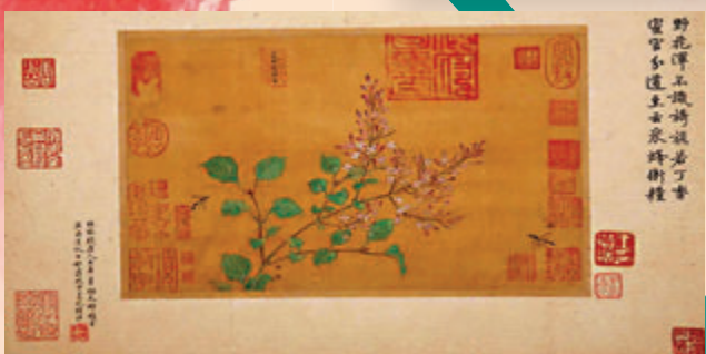
▲南宋《雜景院畫》之林椿《丁香黃蜂圖》