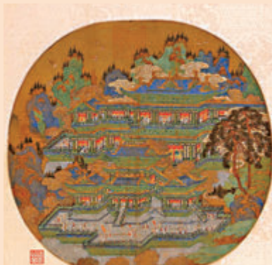
▲三峽博物館展出70餘件鎮館之寶，圖為元代《仙山樓閣圖》團扇面