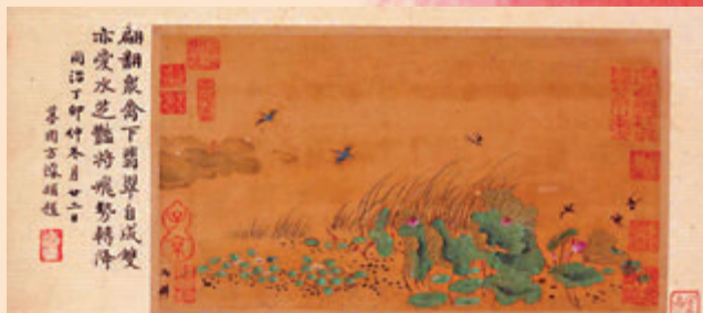
▲南宋《雜景院畫》之馬麟《荷塘清暑圖》