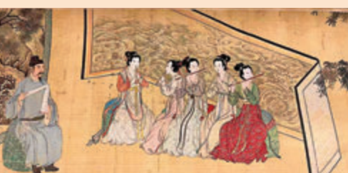
▼唐寅《韓熙載夜宴圖》局部，行筆秀潤瀟灑，又現韻度。

唐伯虎天資聰穎，16歲蘇州府試第一，28歲南直隸鄉試中解元。滿懷信心又有着一腔熱血的唐伯虎，29歲參加會試時，受到科場舞弊案的牽連，被罷黜，以此為恥，四處遊蕩，縱情酒色。唐寅臨摹此圖，在背景中作了改動，使人物形象更顯濃艷華麗，觀者能通過韓熙載的眼神窺視到唐伯虎本人痛苦、矛盾的內心世界。