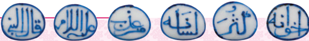
● 阿拉伯文罐頸部六字阿拉伯諺語意為「聖人說：廣交朋友，少說話。」

右，不同於永宣年間所燒製的適用於伊斯蘭地區慣用器物的尺寸(通常為40-50公分)，可見這類富阿拉伯元素的瓷器為宮廷內部的御用瓷，而非外銷之物。2005年9月，紐約蘇富比一件正德青花阿拉伯文四方瓶，以169.6萬美元(折合約1,323萬港元)成交，闖入「千萬陣營」；2011年，香港佳士得的明正德青花靈芝紋開光阿拉伯文罐，以高於估價一倍的1,051.6萬港元成交，是獨特的明正德阿拉伯元素瓷器受到青睞的表現。