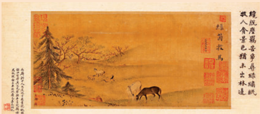
▲南宋《雜景院畫》之馬麟《綠茵牧馬圖》

重慶中國三峽博物館藏《雜景院畫》冊為絹本設色，是用國畫原料在絹上創作而成。畫冊共8幅，分別為《丁香黃蜂圖》、《瓊花真珠雞圖》、《叢花蛺蝶圖》、《鶴鶉圖》、《清風搖玉珮圖》、《綠茵牧馬圖》、《葵花獅貓圖》以及《荷塘清暑圖》，是南宋時期馬麟、許迪、林椿、李從訓、韓祐、李瑛、陳居中七位宮廷畫家的作品。每幅畫縱13.8厘米，橫22.3厘米，小巧精緻，盡顯「院畫」風格。