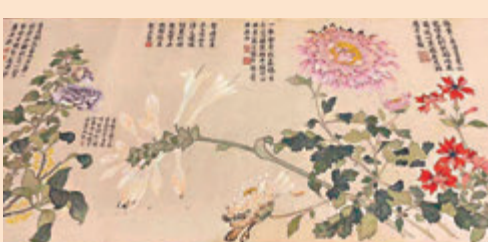
▲錢維城的這幅《九秋圖》畫作，描繪了秋天時節九種競相盛開的花卉。

畫卷上的「乾隆御覽之寶」、「乾隆鑒賞」、「嘉慶御覽之寶」、「宣統御覽之寶」等多方清朝皇帝印章分外搶眼，令畫作充滿了宮廷富貴之氣。就連用來別住手捲開口的玉質「別子」上，都刻有「乾隆御覽之寶」描金六字。