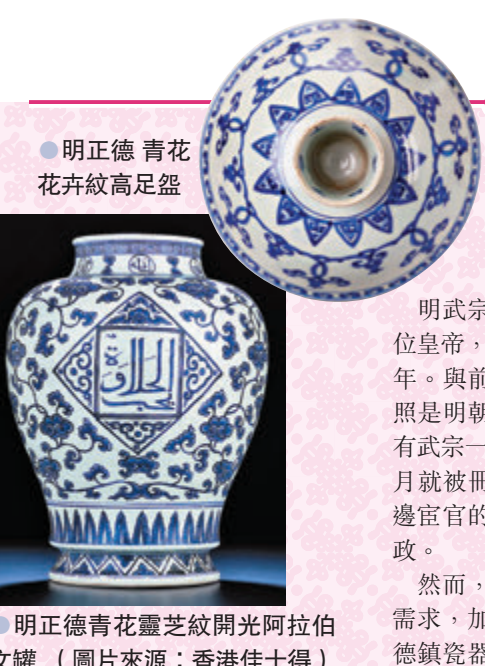
● 明正德青花靈芝紋開光阿拉伯文罐

當這幅548厘米長的卷軸全部展開時，觀眾發出連聲驚歎，歷經500餘年的絹本保存完好，工筆設色華麗，無論遠觀還是近距離欣賞都非常震撼。全畫描繪了「聽樂」「觀舞」「小憩」「清吹」「送別」5個場景，在唐寅《臨韓熙載夜宴圖卷》中，「聽樂」場景，5位侍女手持樂器，坐在水鏡屏風前演奏。她們服飾華麗，流暢自如的線條表現出布料輕柔的質感和輕鬆的體態。