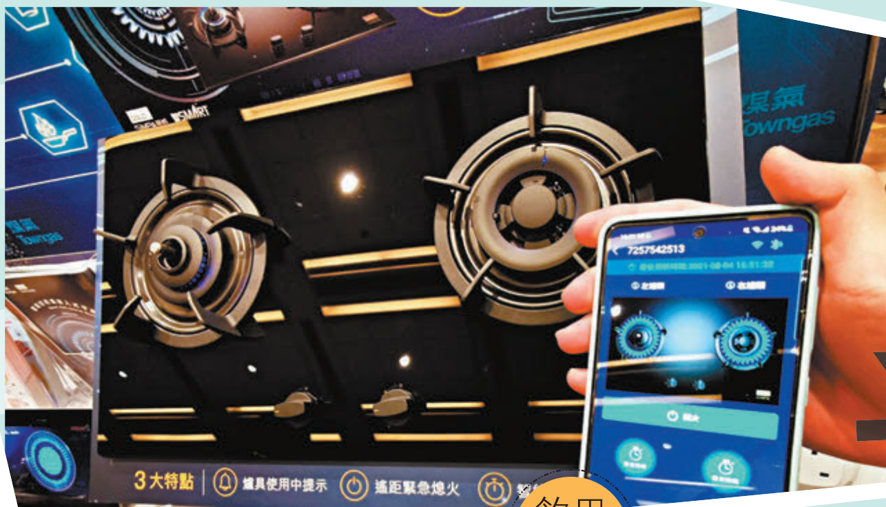
●這IoT智能防乾燒煤氣煮食爐，剛於博覽中登場，結合全新「煤氣智慧爐具」手機應用程式，讓用戶隨時隨地監察爐具使用情況，帶來全新智能煮食體驗。