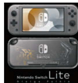
●Switch Lite 推出《Pokemon》版主機。

任天堂秋季超大作《Pokemon 晶燦鑽石/明亮珍珠》11月中應市，而開放世界玩法的野心作《Pokemon 傳說 阿爾宙斯》則落實明年1月底推出，由於兩者都對應寄精靈用的《Pokemon Home》工具軟件，令之前已在玩「比卡超/伊布版」與「劍/盾版」甚至手提電話作品《Pokemon Go》的朋友可藉《Home》來交換強力精靈，組成超強隊伍擊倒對手。另外，任天堂宣布於11月5日推出備有兩大神獸的金/銀色塗裝黑色Switch Lite主機，機能上它和現時的Switch Lite相同，有興趣想出機的朋友可以考慮。