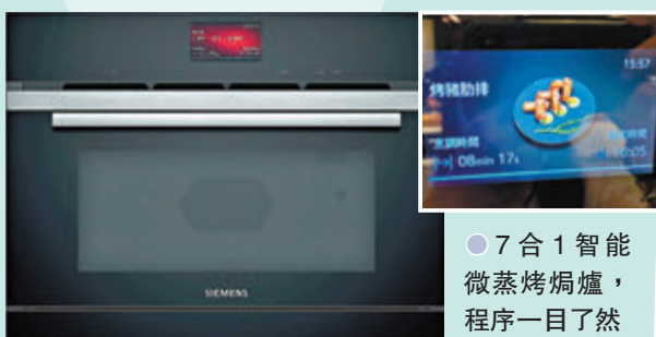
●7合1智能微蒸烤焗爐，程序一目了然