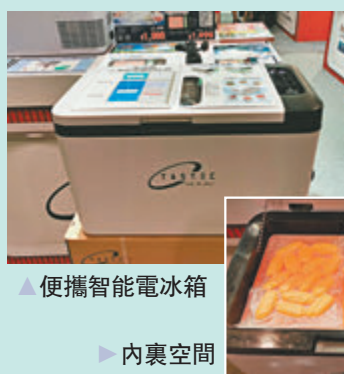
●便攜智能電冰箱 內裏空間

這副TASTEC便攜智能電冰箱，外形時尚，備有25升儲存容量，箱內設冷藏冷凍分區，提供多種食物儲存選項，速凍潔淨保鮮，高品質聚氨酯泡沫絕緣材料，德國技術壓縮機，高效寧靜運作，它可以USB輸出電源予其他電子產品，由室溫至0度只需35分鐘，斷電蓄冷3小時（由-18度至9度），卓越製冷雪藏效能，可調較製冷溫度至-18度，數碼顯示屏輕觸及藍牙調控，輕盈便於攜帶，平穩防滑。