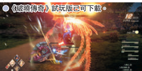
●《破曉傳奇》試玩版已可下載。

Bandai Namco人氣JRPG《傳奇》系列最新作《破曉傳奇》將於下月9日在PS4、PS5、XSX|S和X1推出（Steam版則是10日），今集大幅強化畫面表現效果和戰鬥爽快感，挑戰次世代平台機能的同時也保留初心，沒在角色刻畫和劇情上馬虎了事，《傳奇》擁躉以至一般JRPG迷都值得留意。為提早讓支持者體驗本作魅力，廠方已在PS及Xbox平台提供試玩版，除基本的戰鬥教學、露營、料理、小劇場外，玩家在試玩版還可接下支線任務與強敵「巨體」戰鬥。另除了主角奧爾芬外，玩家在本體驗版也可操作其他夥伴戰鬥，而且更會因應遊戲開始時所選的角色來讓故事宣傳片產生變化。