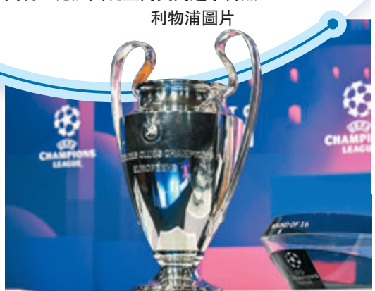
●歐聯分組賽將於歐洲時間26日進行抽籤。 資料圖片