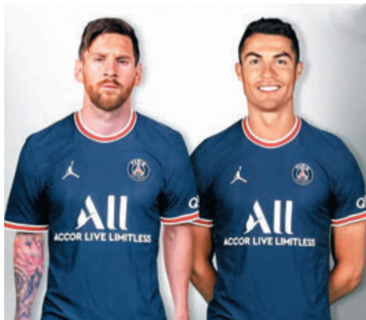
●PSG有幕後金主成員，將美斯(左)與C朗改圖成為隊友。