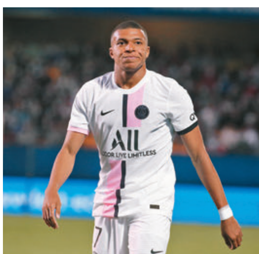
●基利安麥巴比會否在今夏成功轉會?