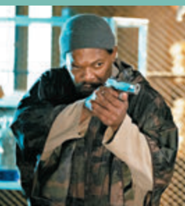
●森姆積遜飾演殺手。