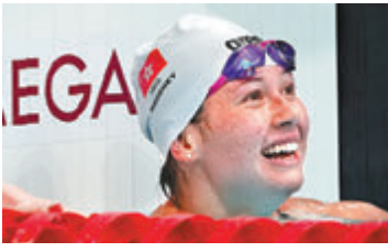
●何詩蓓轉戰意大利ISL游泳聯賽,打破50米自亞洲短池紀錄。資料圖片

香港文匯報訊(記者 黎永淦)東京奧運為香港奪得2面銀牌的「美人魚」何詩蓓(Siobhan),