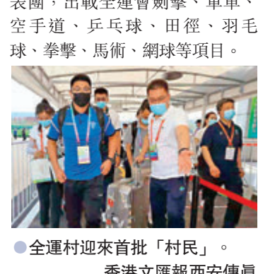
●全運村迎來首批「村民」。

人員,均已全部到位。十四運將於2021年9月15日至9月27日在陝西舉行,共設有34個大項51個分項387個小項,參賽代表團38個。作為賽事期間涉賽人員共同的「家」,全運村分設運動員村、技術官員村和媒體記者村,總佔地680畝,共有住宅56棟、房間2,975套、床位12,176張。香港將派出由171名運動員及66名隨隊工作人員組成的237人代