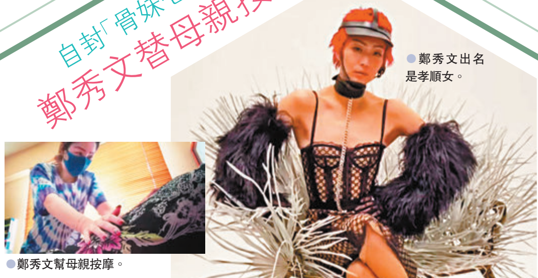
● 鄭秀文出名是孝順女。