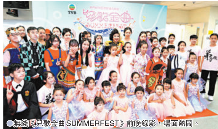
● 無綫《兒歌金曲SUMMERFEST》前晚錄影，場面熱鬧。