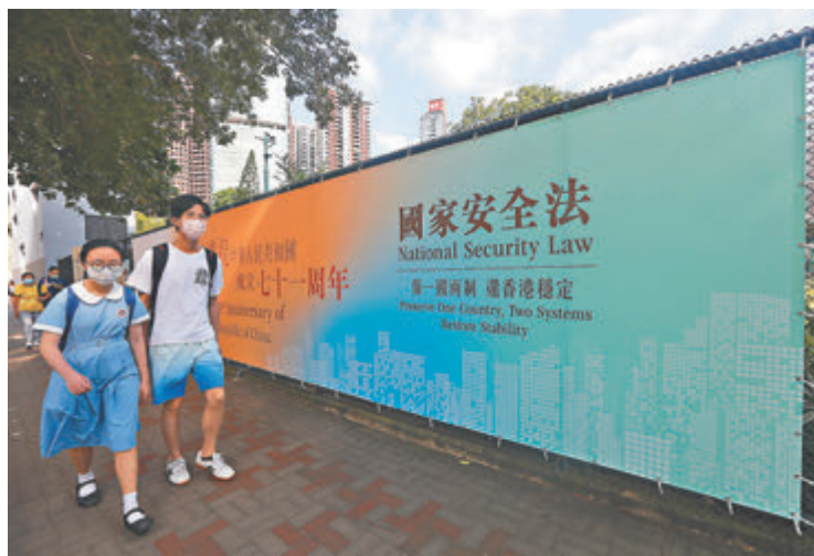
●教總未來會提供更多有關香港國安法的教育講座。圖為學生路過政府的國安法宣傳板。資料圖片