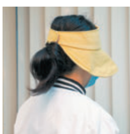
●A老師憶述道，自己多次遇到不公平對待。

對於職場新鮮人而言，工作經驗固然重要，不過，員工的應有權益亦應受到保障。原本任職小學的A老師，開學後竟由「常額教師」變為「合約教師」，她亦曾簽署沒有列明薪酬的合約，面對種種不公平，由於人生經驗不足，選擇了啞忍。現在回想起來，她覺得應該及早向教育人員總會反映情況，也期望藉着自身經歷，呼籲年輕教師積極尋求協助。