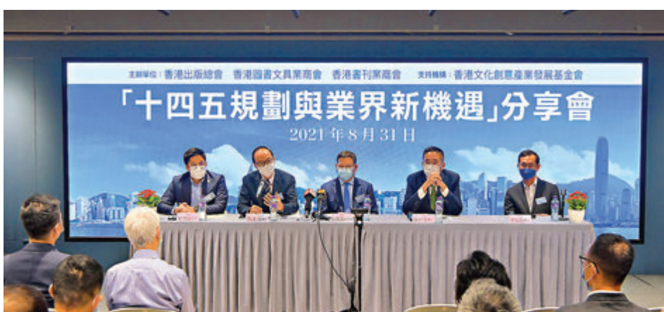
香港出版界昨日舉行「十四五規劃與業界新機遇」分享會，幫助業界人士把握「十四五」發展機遇。

香港文聯常務副會長霍啟剛表示，2008年至2018年十年間，香港文創產業在GDP中佔比約4.4%，大部分產業份額如藝術品、電台、廣告等均增長約1.6倍，與整體GDP增長率相若，推出版業萎縮，產值由150億元跌至130億元。要改善出版業情況，不僅需要行業自身做到「講好中國故事」，還要特區政府從不同渠道的支持，推動文化事業產業化，如成立專責機構，從資金、人脈等方面幫從業者獲取資源，讓業界在稅務、用地條件等方面