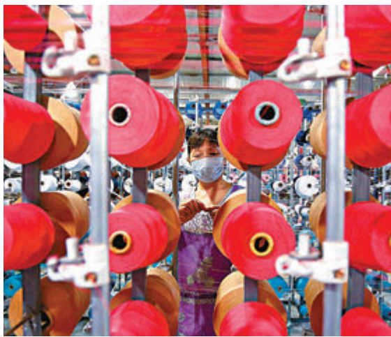
●中國製造業採購經理指數降至50.1，略高於榮枯分界線。

香港文匯報訊（記者 海巖 北京報道）由於近期內地疫情、汛情及傳統生產淡季等影響，8月中國製造業採購經理指數（PMI）和非製造業PMI雙雙降至去年3月以來最低。前者較7月下降0.3個百分點至50.1，略高於榮枯分界線；後者則大幅下滑5.8個百分點至47.5，為去年3月以來首次降至收縮區間。