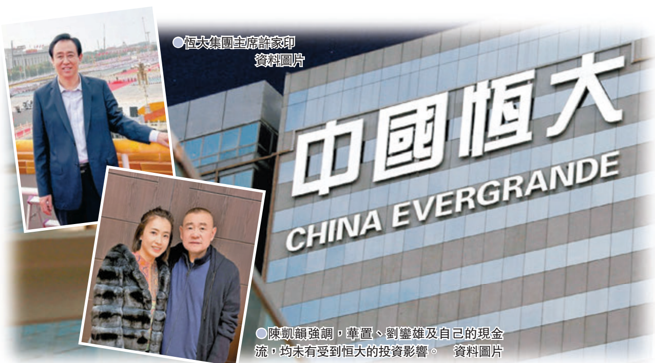
●恒大集團主席許家印 資料圖片