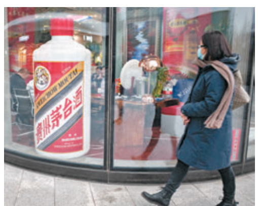
●弱勢的貴州茅台在昨日跌近2%，收報1,558元人民幣。

銀河證券分析，目前流動性仍較充裕，9月出現系統性風險可能性較低，但市場向上動力不足，需注意風險。