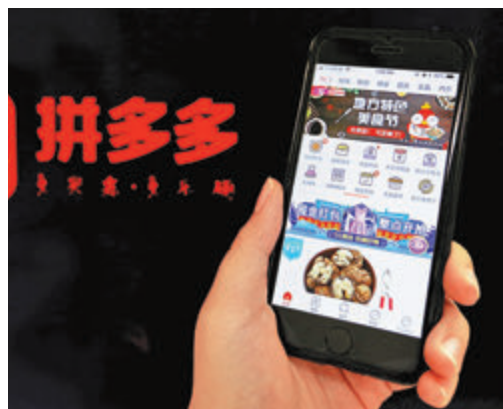
●內地計劃加強對電子商務企業的監管。

香港文匯報訊 淘寶網、拼多多等電商平台將面臨新的監管。為加強知識產權保護，規範平台經濟秩序，促進電子商務持續健康發展，內地計劃加強對電子商務企業的監管，擬修訂相關法律加大對侵犯知識產權的懲處力度。