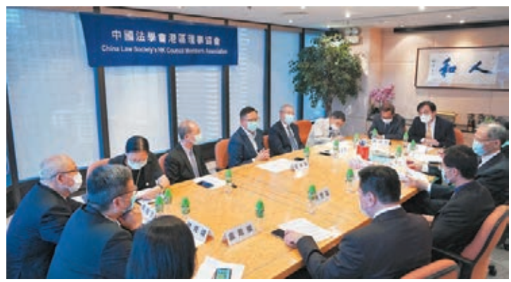
●中國法學會港理事協會昨日舉行「『十四五』規劃對香港法律界的機遇座談會」。

造、共建「一帶一路」的功能平台，更要學習與內地法律人士深度協作，共同推動國家法律建設，推動全面依法治國。