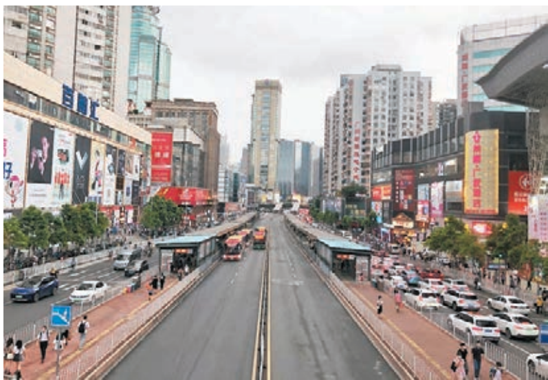
●新政策加強粵港澳規劃行業交流，亦促進三地城市規劃和管理的互補發展。圖為廣州規劃建設的BRT快速公交。

香港文匯報訊 廣東省自然資源廳官網昨日發布消息，為加強粵港澳規劃行業交流，積極服務粵港澳大灣區建設重大戰略，推動香港、澳門地區城市規劃專業企業更好地參與廣東省規劃編制業務，經國家自然資源部同意，廣東省自然資源廳近日就港澳地區城市規劃專業企業在廣東省執業備案的有關事項發出通告，公布符合執業備案條件的港澳地區城市規劃專業的企業，可向廣東省自然資源廳提出備案申請。備案受理後，這些港澳地區城市規劃專業企業可在執業備案有效期內，即兩年內在廣東省內從事執業範圍內相關規劃業務，其出圖章與內地規劃編制單位企業具有同等效力。