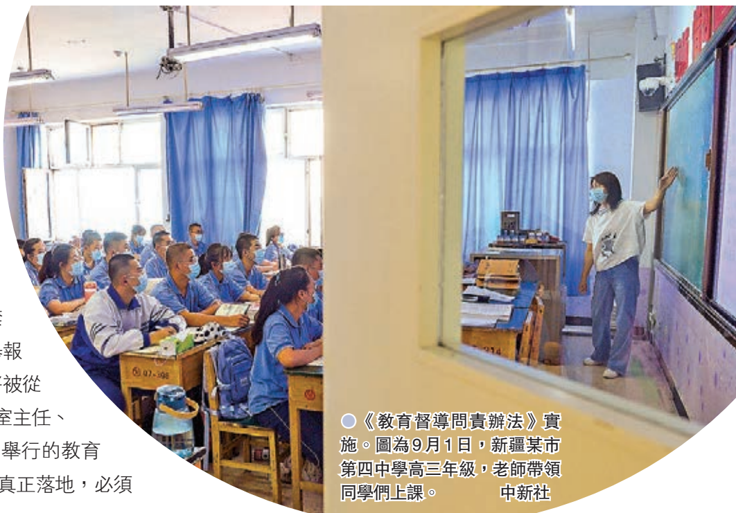
《教育督導問責辦法》實施。圖為9月1日，新疆某市第四中學高三年級，老師帶領同學們上課。

香港文匯報訊（記者 江鑫嫻 北京報道）《教育督導問責辦法》（下稱《辦法》）1日起正式實施。教育教學質量下降、辦學行為不規範等六類情形將被問責。將對責任人採取責令檢查、約談、通報批評、組織處理、處分、移交監察機關或司法機關等問責方式。對於教培機構責任人，還可採取依法罰沒違法所得、從業禁止、納入誠信記錄等問責方式。對舉報人、督學等人打擊報復等五種情形將被從重處理。國務院教育督導委員會辦公室主任、教育部教育督導局局長田祖蔭在1日舉行的教育部發布會上表示，讓督導「長牙齒」真正落地，必須制定專門的問責辦法。