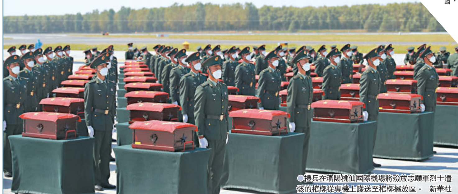
●禮兵在瀋陽桃仙國際機場將殮放志願軍烈士遺骸的棺槨從專機上護送至棺槨擺放區。