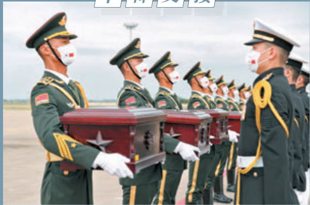
●9月2日，在韓國仁川國際機場，中國人民解放軍禮兵（左）從韓方接過中國人民志願軍烈士棺槨。