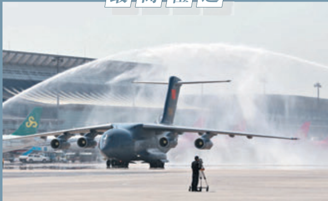
●瀋陽桃仙國際機場以「過水門」最高禮遇迎接運送烈士遺骸的專機。