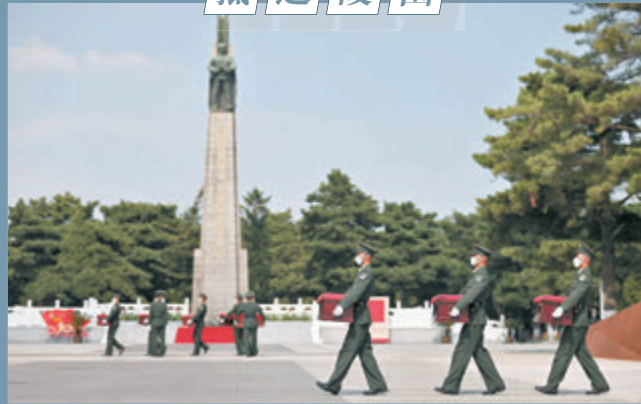
●9月2日，志願軍烈士的遺骸抵達瀋陽抗美援朝烈士陵園。

「感謝你們把英雄送回祖國。鐵血今猶在，山河已無恙，向中國人民志願軍忠烈致敬！」9月2日11時26分，當搭載着第八批在韓中國人民志願軍烈士遺骸的「運-20」專機平穩降落在瀋陽桃仙國際機場時，機場塔台的廣播如是向烈士們致敬。 ●中新社