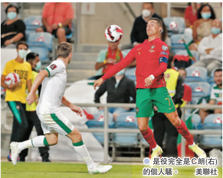
●是役完全是C朗(右)的個人騷。

言，雖然職業生涯只剩數年，但仍要繼續發光發熱，「現在，我要將入球和紀錄，獻給所有葡萄牙人、每一個家庭。」不過，或許是比賽爭勝心太盛，比賽中有片段拍到C朗在一次準備開罰球前，不忿對方達拉奧沙撥走他放好的皮球，出手疑似擱了奧沙面部一下，後者隨即掩面彎腰，但C朗卻沒被球證判罰，這受到不少網民的爭議。這些報復性動作，根據球例有可能會被罰紅牌離場。事實上，C朗職業生涯就曾領下11面紅牌，假如C朗今仗真的被罰離場，恐怕就沒有之後反敗為勝的故事了。