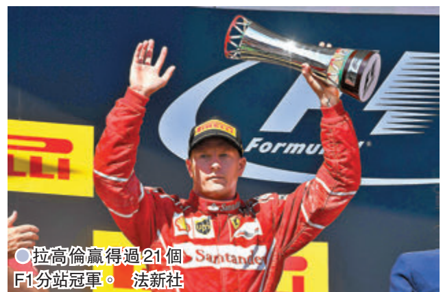
●拉高倫贏得過21個F1分站冠軍。

「這將是我在F1的最後一個賽季，這是我在去年冬天作出的決定。這不是簡單的決定，但本賽季結束後是時候開始新篇章了。儘管賽季還沒結束，我想感謝我的家人、我效力過的車隊、我賽車生涯中的每個人，特別是那些一直支持我的車迷。我的F1生涯或許來到了終點，但生活中還有很多我想去體驗和感受的事情。後會有期！」他在社交媒體上寫道。現年41歲的拉高倫是今屆F1中年齡最大的