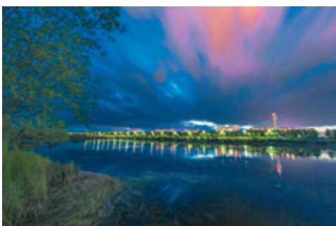
●加格達奇一景。 穆莊嚴的紅軍行軍隊伍，不純是靜謐...