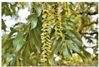
●楓楊樹上掛滿了「元寶」，也像小女孩的辮子。