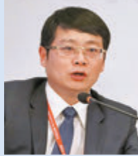
●金融研究院院長管清友。資料圖片