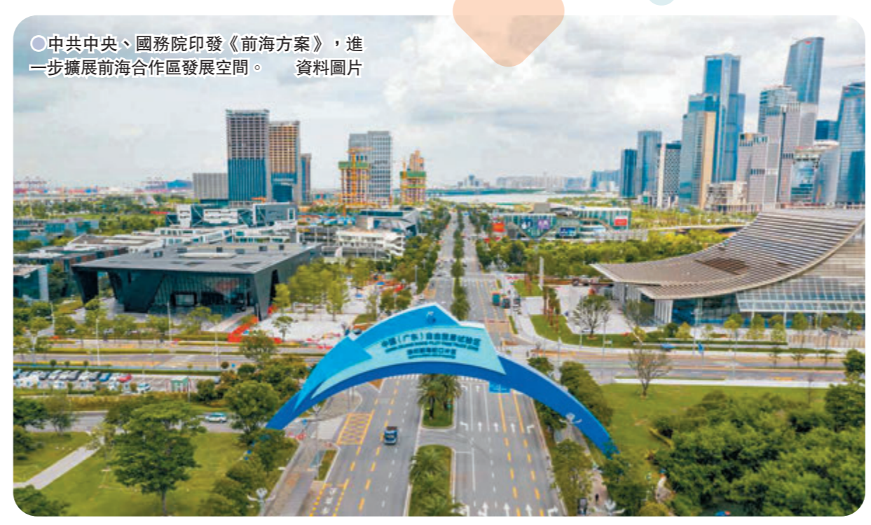
◎中共中央、國務院印發《前海方案》，進一步擴展前海合作區發展空間。 資料圖片

發言人9月6日還發表談話表示，中央政府9月5日正式公布《橫琴粵澳深度合作區建設總體方案》（以下簡稱《橫琴方案》），這是中央從國家戰略全局的高度支持澳門經濟適度多元發展的重要舉措，是豐富「一國兩制」實踐的制度和體制創新，為澳門長遠發展拓展了空間、勾畫了藍圖，必將為澳門經濟發展注入強勁動能，有力推動澳門更好融入國家發展大局，促進澳門長期繁榮穩定。 發言人表示，對香港、澳門發展而言，「一國兩制」是最大的優勢，國家改革開放是最大的舞台，共建「一帶一路」、粵港澳大灣區建設等國家戰略是新的重大機遇。《橫琴方案》的出臺和實施，充分表明了中央進一步深化改革、擴大開放的強大決心，充分體現了中央對澳門長遠發展和民生改善的有力支持以及對澳門同胞福祉的最大關愛，充分彰顯了中央不斷豐富和發展「一國兩制」實踐的堅定信心。偉大祖國永遠是澳門發展的堅強後盾。