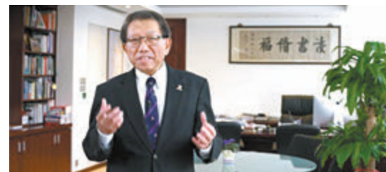
●段崇智寄語中大新生接納多元價值。他在疫情的挑戰下，考進大學展開人生的新一頁。