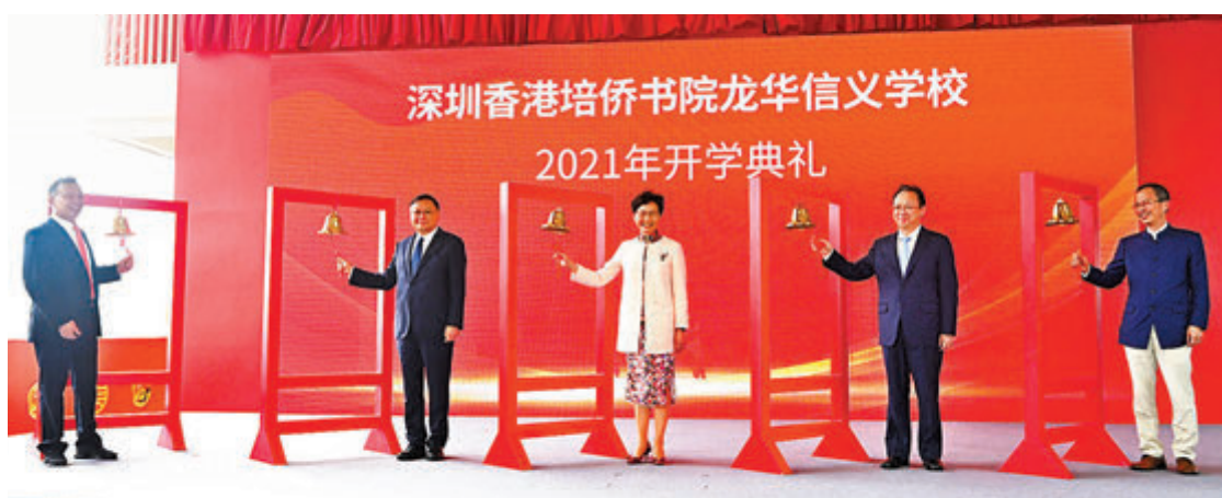
●深圳香港培僑書院龍華信義學校2021年開學典禮。林鄭月娥（中）、王偉中（左二）、譚鐵牛（右二）、李賢義（左一）、曾鈺成（右一）主持典禮。

林鄭月娥致辭表示，深圳香港培僑書院龍華信義學校今年2月簽約動工，短短7個月新校舍已經建成，學校順利開辦，體現了國家以及深圳市的高效及發展速度。國家及特區政府都鼓勵和支持港人到灣區發展。粵港澳大灣區的發展一日千里，區內的人流、物流、資金流和信息流越來越緊密，區內對於專業服務、貿易、航運物流等方面的人才需求大大增加。 她表示，深圳培僑的開辦將進一步豐富大灣區內港人子女就學的選擇，同學除了能夠在香港課程框架下學習外，同時能夠近距離了解國家的最新發展，也有更多與其他大灣區青少年交流的機會，未