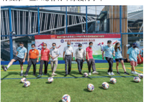
●主禮嘉賓們首先開球，共同為香港深圳社團總會青年委員會第二屆「愛國杯」足球賽揭幕。

東湖青年隊、福永青年協進會隊、福海藍鯨隊、東門隊、民治青年隊、深總青委隊、龍城青年隊、福田區青年隊、新沙隊、松崗青年隊、燕羅青年隊、鹽田總會青年隊12支足球隊，經過一下午的激烈追逐與比拼，最終龍城青年隊獲得冠軍，福海藍鯨隊獲得亞軍，深總青委隊、鹽田總會青年隊獲得季軍。