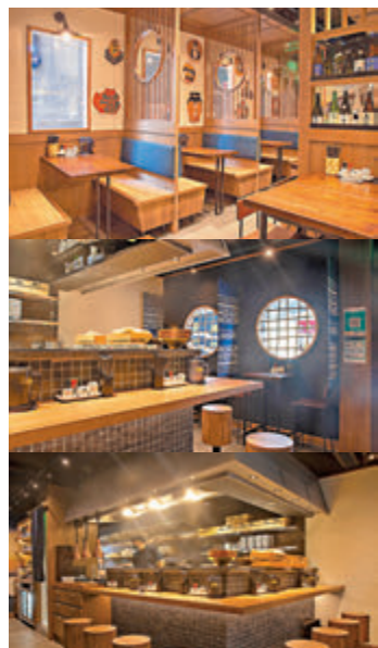
●神山環境採開放式廚房設計，極富東京麵店風味。