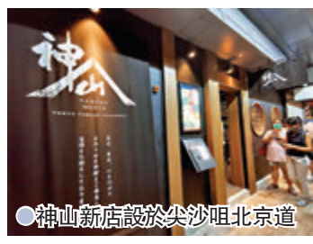
●神山新店設於尖沙咀北京道