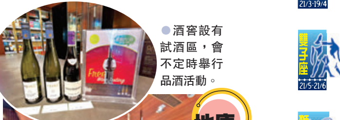
●酒窖設有試酒區，會不定時舉行品酒活動。