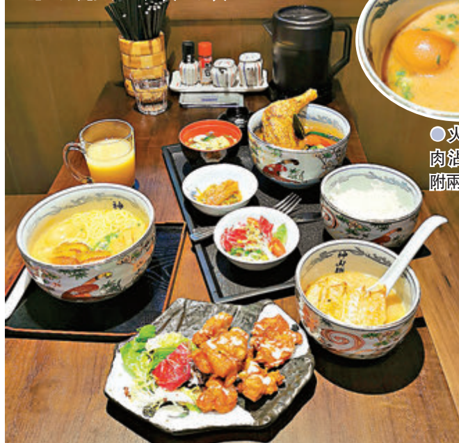
●火山極盛豚肉沾汁麵，會附兩碗沾汁。