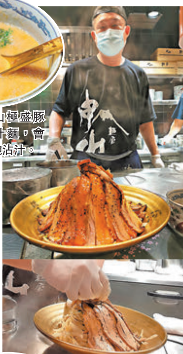
▲大廚即席製作重量級火山極盛豚肉沾汁麵