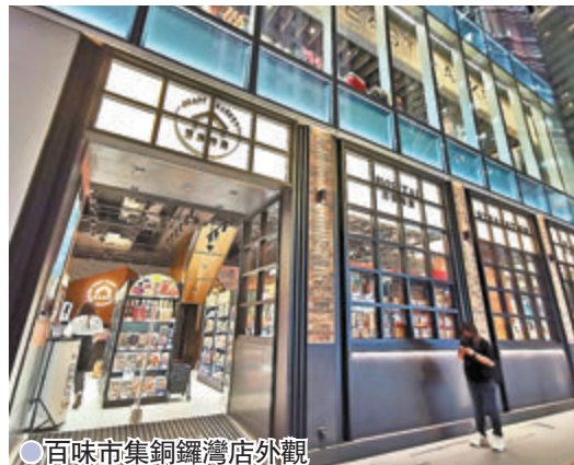
●百味市集銅鑼灣店外觀