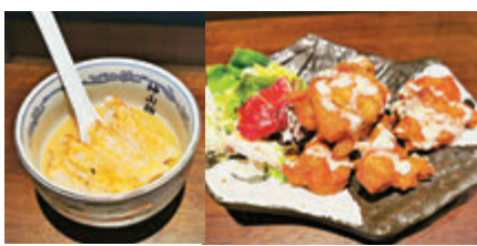
●神山湯餃子 ●神山炸雞