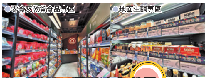
●零食及乾貨食品專區