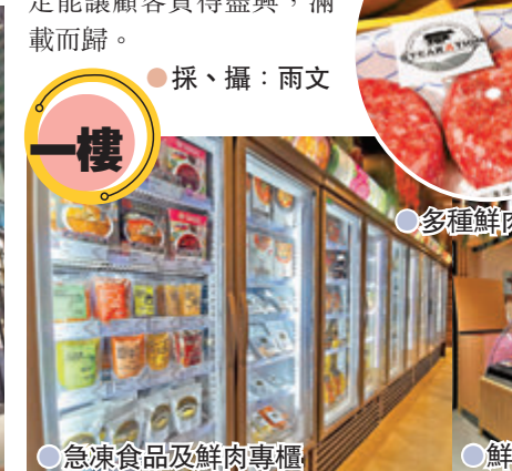
●急凍食品及鮮肉專櫃