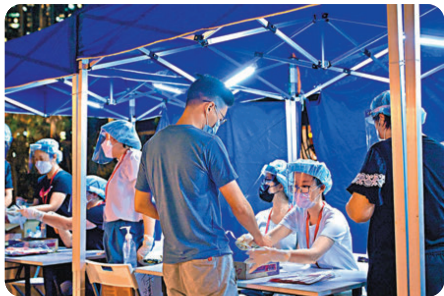
▲政府前晚就將軍澳日出康城2A期領都2座封區檢測，工作人員為受檢人士戴上手環，證明他已接受檢測。