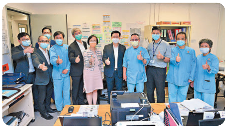
●李家超（右五）、羅致光（左五）、陳肇始（左六）、孫玉菫（左一）及羅繼禮（左三）昨午到嶼山竹篙灣檢疫中心，為醫護人員打氣。

當地採樣能否改善，以減低有感染病毒外傭上機來港的風險，「如不斷有外傭的確診個案，在熔斷機制下，有機會所有航班都斷續，可能一段時間內，菲律賓