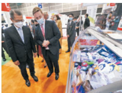
●陳茂波(左)參觀展覽。