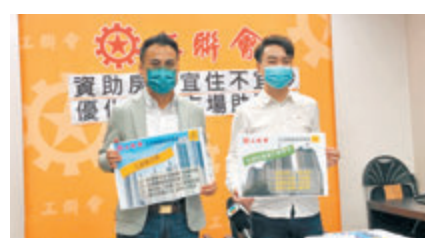
●工聯會建議政府取消新資助房屋的補地價安排，並延長轉售期限遏止炒風。

為了解市民對居屋炒風的意見，工聯會在今年7至8月訪問306名市民，結果顯示逾七成受訪市民同意及非常同意當下居屋第二市場已出現炒賣及價格偏高；92%受訪市民認為，不論何類型的資助房屋都不應淪為炒賣工具；近九成受訪者同意擴大「白居二」名額、