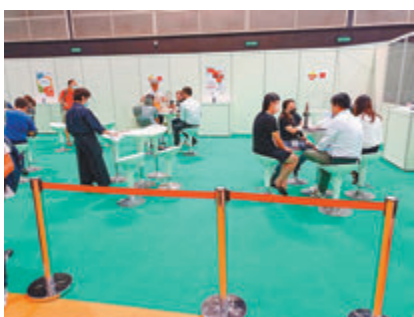
●會場設「指定試食區」，讓潛在買家品嚐後才採購。