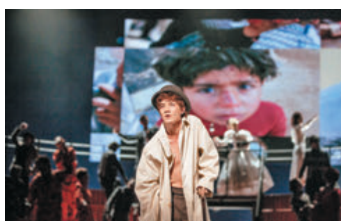
●莎士比亞的妹妹們的劇團《混音理查三世》