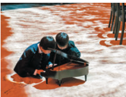
●黃翊工作室+《小螞蟻與機器人：遊牧咖啡館》

導演王嘉明將2015年首演的《理查三世》重新打造，融合實時錄影、現場配音、人偶同台，拓展劇場的想像空間，帶領觀眾跟隨理查三世這位聲名狼藉的國王，一起找出隱匿在時間中的真相。