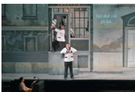
●羅西尼歌劇《塞維亞理髮師》

今年的「遇見巨人」演出季，除了建團35周年的當代傳奇劇場帶來著名京劇藝術家吳興國改編自卡夫卡名作的獨角戲《蛻變》，以及唐美雲歌仔戲團演繹改編自日本文學經典《源氏物語》的《光華之君》外，還帶來數齣新世代的創新之作。2019年台新藝術大獎獲獎編舞家布拉瑞揚將帶來舞作《#是否》，以流行用語符號「#」（hashtag標籤符號）為題，青年舞者們自選「人生主打歌」，將劇院化身為卡拉OK包廂，在一首首經典流行歌曲中，唱出、舞出自己的生命故事。舞蹈劇場《小螞蟻與機器人：遊牧咖啡館》中，編舞家黃翊乾脆帶來機器人好朋友庫卡，邀請大家入座，為第一次入劇場的孩子們提供新奇想像，也激發觀眾對藝術與科技的好奇。江之翠劇場的《行過洛津》則改編自著名小說家施叔青的小說，故事講述清朝年間，梨園戲子許情三次搭船到台灣所見證的洛津五十年興衰。精緻南管樂的梨園戲與小劇場結合，映照出大時代下小人物的悲喜，亦讓傳統藝術與當代精神遙相叩問。莎士比亞的妹妹們的劇團則帶來全新版《混音理查三世》，