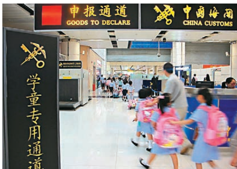
●林鄭月娥表示，已要求教育局研究跨境學童問題。圖為跨境學童穿校口岸。

據了解，上水風溪第一小學於新學年首次在深圳開辦實體學習中心，採用線上線下混合模式，安排內地中心的教職員直播香港課堂畫面，讓跨境童於深圳亦有地方集合上港課，感受課堂氣氛。中心的實體班網課及課後功課輔導班費用每月1,000元至2,000元不等，家長可自行決定子女是否參加。