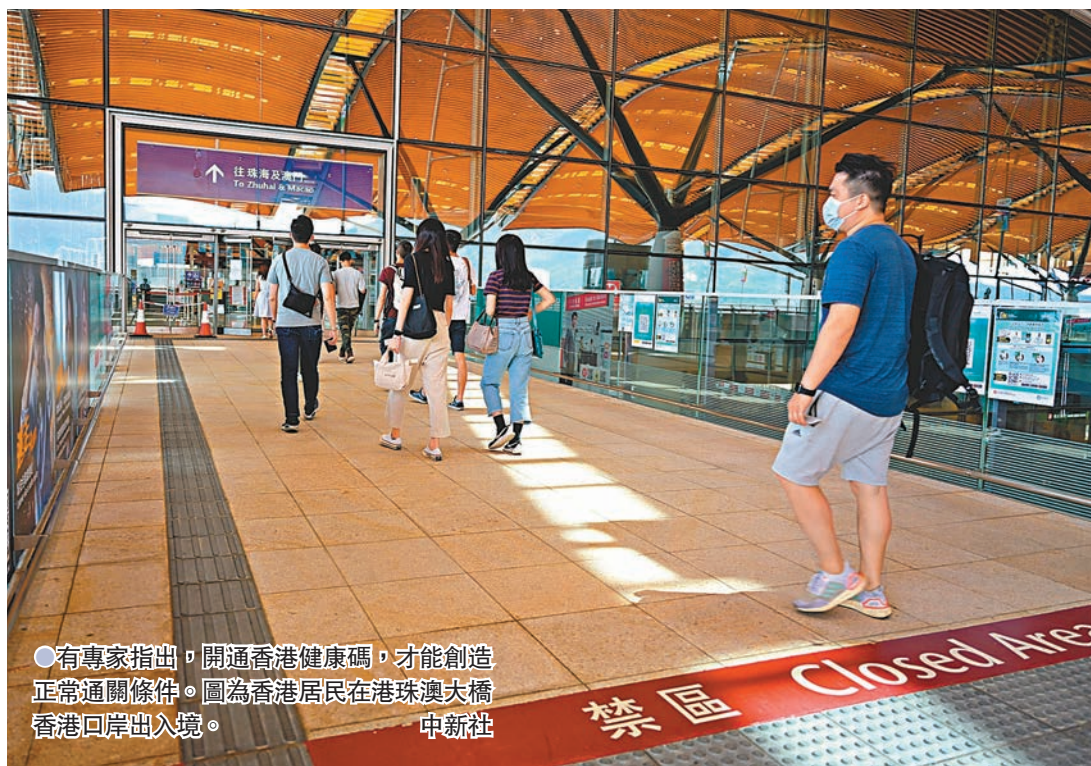
●有專家指出，開通香港健康碼，才能創造正常通關條件。圖為香港居民在港珠澳大橋香港口岸出入境。