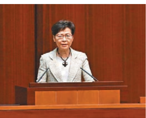
●林鄭月娥強調，若內地提出有利正常通關的先決條件，特區一定會盡全力滿足。

昨日新增的兩宗確診個案，患者分別來自韓國及塞爾維亞，兩人並無病徵，但均被驗出感染L452R變種病毒。新冠肺炎疫情持續在全球肆虐，不少國家及地區改為「與病毒共存」的防疫策略，林鄭月娥昨日出席立法會短問短答環節時表明，該策略現階段並不適用於香港。