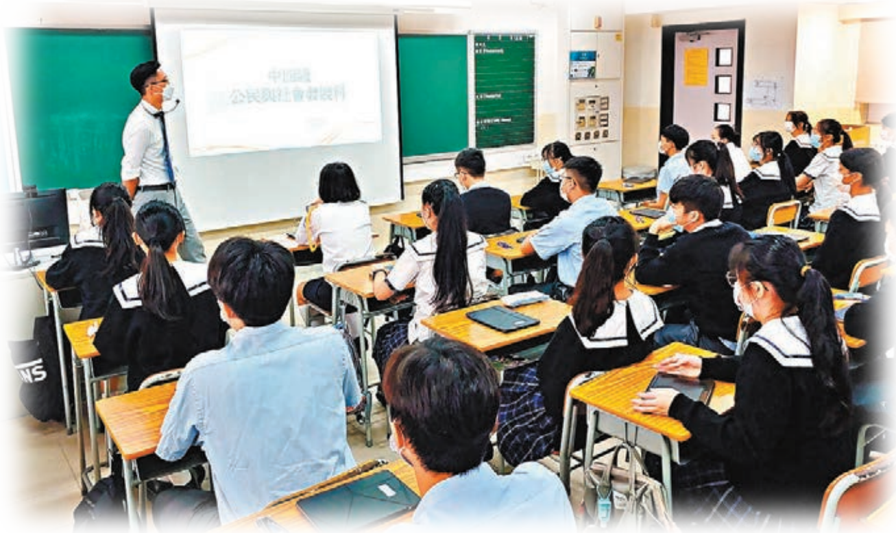
●楊潤雄指，公民科是讓學生了解國家、認識國情的途徑。圖為中學高一年級正上公民科。

楊潤雄並提到，香港於2000年前後曾推動教育改革，旨在培養學生成為科技發展日新月異下的終身學習者，「但當時並沒有充分考慮回歸後的情況，以及將『一國兩制』內涵放到教育裏面」。他認為，「十四五」規劃為香港帶來更多機遇，特區政府會以「以德施教、以教育才、以才壯區、以區獻國」作為教育的目標，更笑言：「當中的『區』代表特區，也代表粵港澳大灣區，希望我們能培養才德兼備的人才、愛國愛港的人才！」