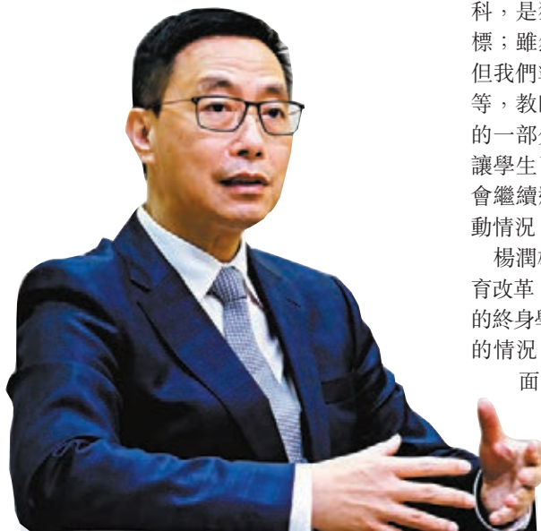
●楊潤雄表示，香港應該考慮如何運用「一國兩制」下的優勢。

楊潤雄強調，除了知識及能力上面的積累，更重要的是公民科可為學生建立正確價值觀，「我們要增加學生對香港憲制地位的認識，『一國兩制』的內涵，以及國家發展及成就，