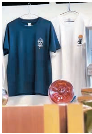
●浸會大學內疑似公然販賣黑暴產品，宣揚歪風。

香島中學校長鄧飛就指，若然學生在校園內以隱晦方式販賣宣揚黑暴物品，實屬是以「潛水式」保留黑暴火種，以待日後再燃大火；如果校方一經發現證實存在，應該按照法律和校規採取行動，依法依規取締，若不積極處理，恐怕會令其他學生誤認為此行為被學校和社會接受，繼而常态化存在，長此以往對學校和社會安寧不利；校方亦應勸喻學生要珍惜前程，不要知法犯法。