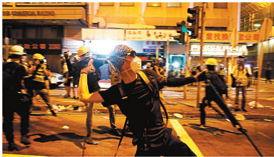
●違法「佔中」以及修例風波期間，均有不少專業者包括社工衝在黑暴最前線，參與違法活動而被定罪和判刑。圖為2019年7月修例風波時有暴徒蒙面擲物。資料圖片

相關個案。書面回覆續指，專業者一般由其監管機構按相關法律規管，而相關政策局亦會按需要檢視監管機構的工作，確保監管機構有效運作。若有監管機構未能履行其法定職能，特區政府會嚴肅審視，一旦有個別團體偏離成立的宗旨而被政治騎劫或凌駕其專業，以致出現明顯偏袒或推諉塞責的情況，特區政府亦會重新審視與該團體的關係，必要時終止雙方關係。據悉，近日已有消息指特區政府計劃修訂《社會工作者註冊條例》，禁止因干犯國安法定罪者擔任社工。另因應修例風波期間有不少掛羊頭賣狗肉的所謂新工會成立，特區政府亦有意修訂《職工會條例》，使一些違反國安法的工會理事被取消資格。兩項修例工作估計最快今年展開。