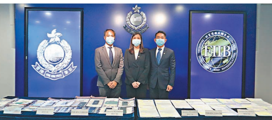
●香港警方交代聯同內地執法部門搗破一個跨境洗黑錢集團詳情。