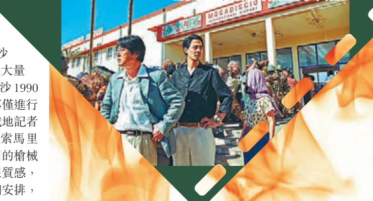
兩位男星首次合作擦出不少火花。