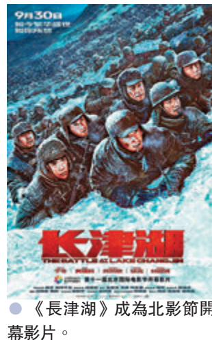
● 《長津湖》成為北影節開幕影片。

沉澱了數天，Angie 仍帶着沉重的心情於社交平台留言：「爸爸離開了已經一星期了，我知道我不能再沉溺在傷痛之中。這些日子，我一直收藏着自己，好朋友也不敢見，一直想逃避現實。但是，生活仍是要繼續，腹中的小