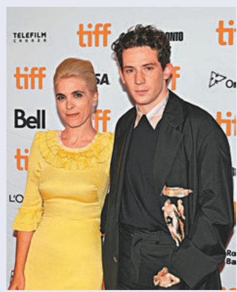
● Josh O'Connor 借導演出席《Mothering Sunday》首映。