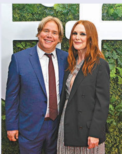
● 茱莉安摩亞與導演 Stephen Chbosky 合照。

綜合報道 第46屆多倫多國際電影節於加拿大時間9月9日揭幕。由於新冠疫情影響，本屆持續10天的電影節繼續採取線上與線下展映相結合的方式進行。未知是否疫情影響，揭幕首天亮相的巨星欠奉，只見曾奪奧斯卡最佳女主角獎茱莉安摩亞 (Julianne Moore) 現身出席《Dear Evan Hansen》的首映禮，不過已經「登陸」(60歲)的她依然星味不減，一出場即成為鎂光燈的焦點。