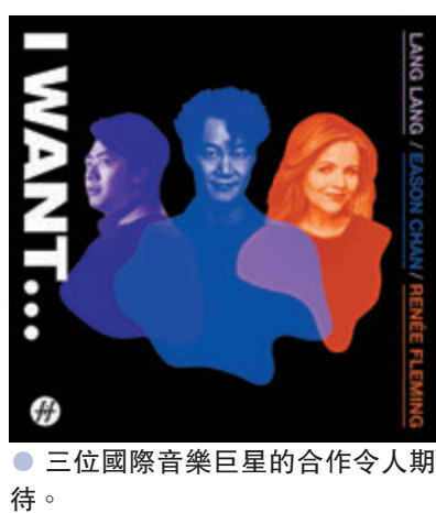
● 三位國際音樂巨星的合作令人期待。

香港文匯報訊 領賢慈善基金會為流行經典歌曲《I Want...》錄製了新唱片及音樂視頻，目的為支持音樂與藝術，是次由香港歌手陳奕迅、內地鋼琴家郎朗和美國歌劇及舞台劇歌唱家 Renee Fleming 合作，並由著名作曲家高世章採用嶄新的方式重新編曲及製作。唱片以英語、粵語及普通話灌錄，以證明音樂真正是無疆界之分。