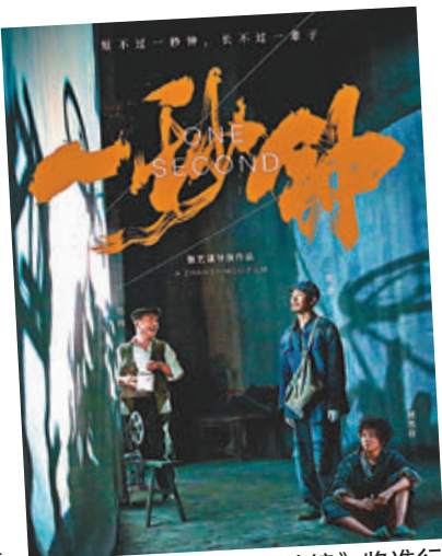
● 張藝謀執導的《一秒鐘》將進行其北美首映。

映，但該片主創人員均不會現身多倫多。參加本屆電影節的華語作品還包括內地年輕導演溫仕培執導的《熱帶往事》等。