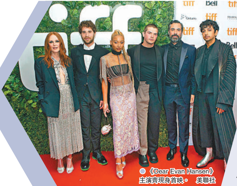
● 《Dear Evan Hansen》主演齊現身首映。

綜合報道 第46屆多倫多國際電影節於加拿大時間9月9日揭幕。由於新冠疫情影響，本屆持續10天的電影節繼續採取線上與線下展映相結合的方式進行。未知是否疫情影響，揭幕首天亮相的巨星欠奉，只見曾奪奧斯卡最佳女主角獎茱莉安摩亞 (Julianne Moore) 現身出席《Dear Evan Hansen》的首映禮，不過已經「登陸」(60歲)的她依然星味不減，一出場即成為鎂光燈的焦點。