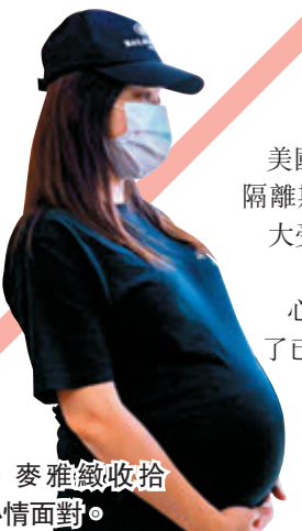
● 麥雅緻收拾心情面對。

據了解，除《聽見台灣》外，北京場還有已故台灣導演李行作品《秋決》等共5部台灣電影在2日至11日間展映。