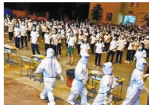
●莆田市擴大到對全鎮24個村總人口10.1萬的核酸檢測。 網上圖片