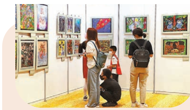
●11日,第十二屆海峽兩岸少兒美術大展在北京開幕,吸引觀眾駐足觀看。

香港文匯報訊 據新華社報道,繼福州、廈門巡展後,第十二屆海峽兩岸少兒美術大展11日在北京台灣會館舉行,展出兩岸暨港澳、海外地區200餘幅少兒美術作品,將持續至9月14日。