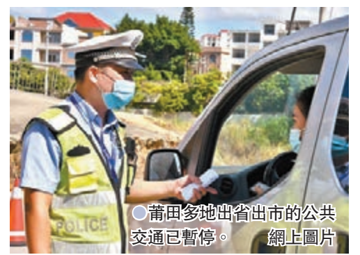
●莆田多地出省出市的公共交通已暫停。