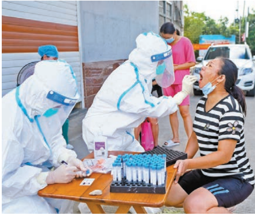
●疫情發生後,莆田組織了1,100名核酸檢測人員,對仙遊縣楓亭鎮進行擴大核酸檢測。截至9月11日16時,累計採集81,938人份樣本, 網上圖片

此外,寧夏也緊急排查旅居仙遊返寧人員。《寧夏日報》9月11日報道顯示,寧夏緊急組織排查8月27日以來有莆田市仙遊縣旅居史返寧人員,凡發現上述人員應立即對其實施7天居家健康監測和2次核酸檢測措施。