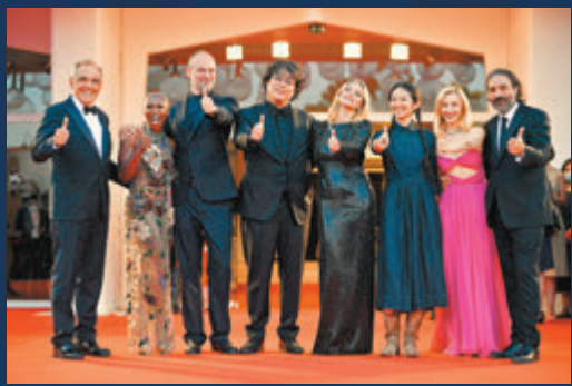
●以韓國名導奉俊昊為首的評審團走紅毯。