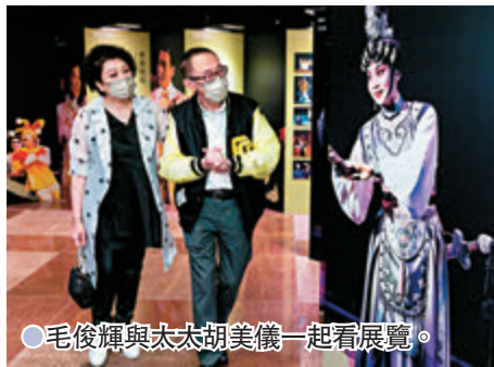
●毛俊輝與太太胡美儀一起看展覽。

香港文匯報訊(記者 李思穎)「戲夢逍遙——毛俊輝從藝五十年」展覽已於前天假香港文化中心大堂舉行開幕禮,展期至9月24日。年屆74歲毛俊輝自1971年於美國完成戲劇碩士學位後,投身專業戲劇行業,至今已從藝五十年,是次展覽將其半世紀對戲劇的追尋,整理為四幕階段——「追夢年代」、「尋根之旅」、「香