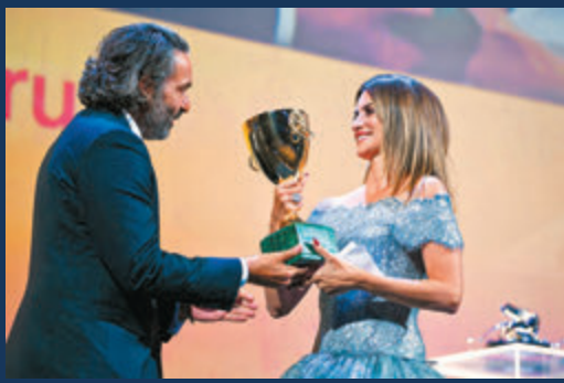
●彭妮露古絲以大熱姿態奪得最佳女演員獎。