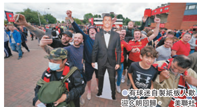
● 有球迷自製紙板人歡迎C朗回歸。