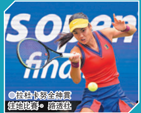
● 拉杜卡努全神貫注地比賽。

和父親也有很強的自信心。」在疫情之前，她每年都會跟媽媽回瀋陽探望外婆，而每次回瀋陽也會參加乒乓球的訓練。7月時首戰大滿貫便在溫網殺進16強，其Instagram粉絲人數一下子由1萬多人暴增至36萬人，經過短短數月現在其IG已有逾130萬追隨者。一躍而成網壇新寵兒，當然還包括不少來自中國的支持，對此她昨天特意通過社交媒體視頻，說中文來向中國球迷表示謝意：「我想說謝謝，希望你喜歡看我打網球，我現在特別特別開心。」