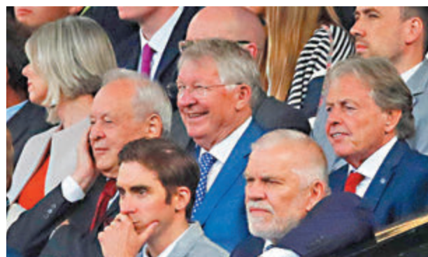
● 有球迷自製紙板人歡迎C朗回歸。