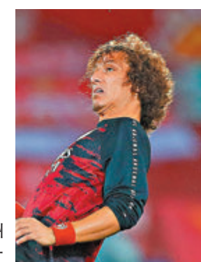
● 綜合外電 大衛雷斯告別歐洲賽場。

今夏與阿仙奴約滿的巴西後防老將大衛雷斯，在歐洲踢球14年後昨天落實回流巴甲聯賽，成為法林明高的球員。