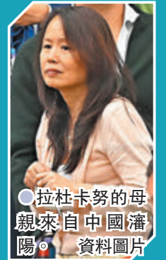
● 拉杜卡努的母親來自中國瀋陽。