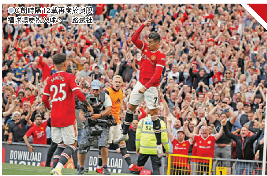
● C朗時隔12載再度於奧脫福球場慶祝入球。