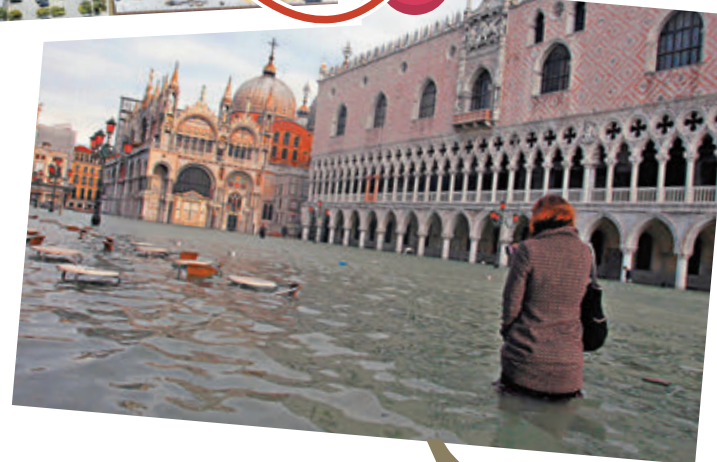
▼ 受全球暖化影響，意大利的威尼斯正受水浸威脅。 資料圖片