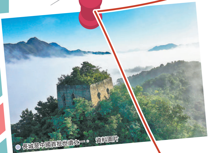
● 長城是中國首批世遺之一。 資料圖片