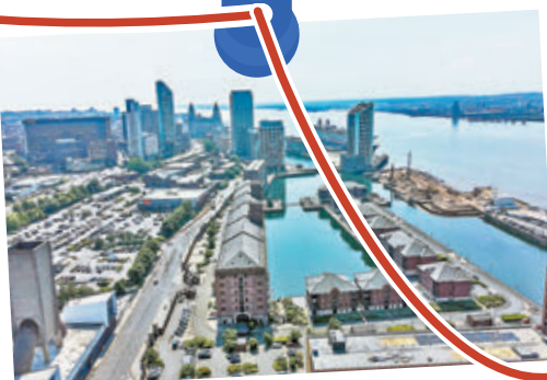
● 英國「利物浦海上商城」因發展計劃，在閉門投票中被除名。 資料圖片

可惜的是，自鄭和下西洋後，朝貢貿易令明朝的負擔愈來愈大，用於賞賜外邦的絲綢和銅幣不敷應用，明朝政府決定減少對外貿易，並把福建省市舶司由泉州遷至福州，令泉州逐漸沒落。