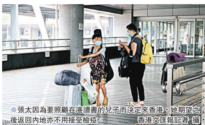
●張太因為要照顧在港讀書的兒子而決定來香港，她期望之後返回內地亦不用接受檢疫。香港文匯報記者攝

繼上星期恢復「回港易」計劃後，「來港易」昨日正式實施。特區政府昨日凌晨開放網上預約系統，讓抵港者申請每日共2,000個的來港配額，以及登記於指定日期入境香港。抵港者只需在入境前3天取得有效核酸檢測陰性結果證明，便可獲豁免強制檢疫安排，惟抵港後第三天、第五天、第九天、第十二天、第十六天及第十九天要接受強制檢測。