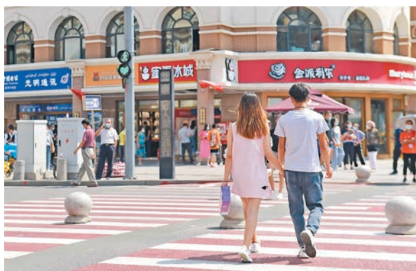
●8月14日(七夕)，一對情侶過烏魯木齊大巴扎景區附近路口，這裏的信號燈出現了心形裝飾。資料圖片

香港文匯報訊（記者 王珏 北京報道）15日發布的《公共安全感藍皮書：中國城市公共安全感調查報告（2020）》顯示，內地城市公共安全感指數達0.5016，而上年則為0.4783，增幅達4.87%，全國城市公共安全感指數普遍上升，其中烏魯木齊、拉薩、廈門三個城市居民的公共安全感最高。藍皮書也指出，在九項分指標中，城市居民交通安全感變動較大，反映出城市交通建設仍需改善。此外，公眾普遍認為信息安全是最不安全的部分，特別是超大特大城市在信息安全方面的表現不盡如人意。