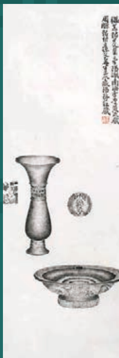
黃士陵 金文全形類拓