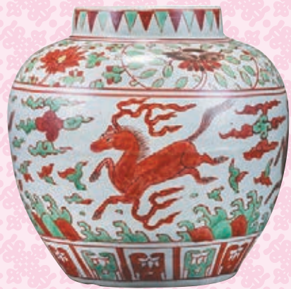
明嘉靖五彩天馬花卉紋罐

明嘉靖五彩罐在當代亦備受追捧。2013年，香港蘇富比拍出一件明嘉靖五彩「荷塘魚藻」紋罐，雖然並不帶蓋，但亦以2,588萬港元的高價成交。而帶蓋的嘉靖魚藻紋罐更是鳳毛麟角，其中四件藏於中國的博物館中，海外重要博物館共收藏不超過十件，而數十年來，亦只有四件帶蓋的嘉靖五彩魚藻罐曾出現在拍賣市場中。