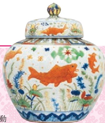
明嘉靖五彩魚藻紋蓋罐