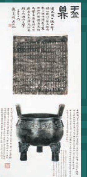
吳湖帆題 大孟鼎未刻本 並朱梅村繪大孟鼎全形