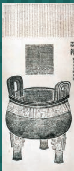
吳大澂、王同愈題 周大孟鼎全形及銘文拓本 潘祖蔭舊藏