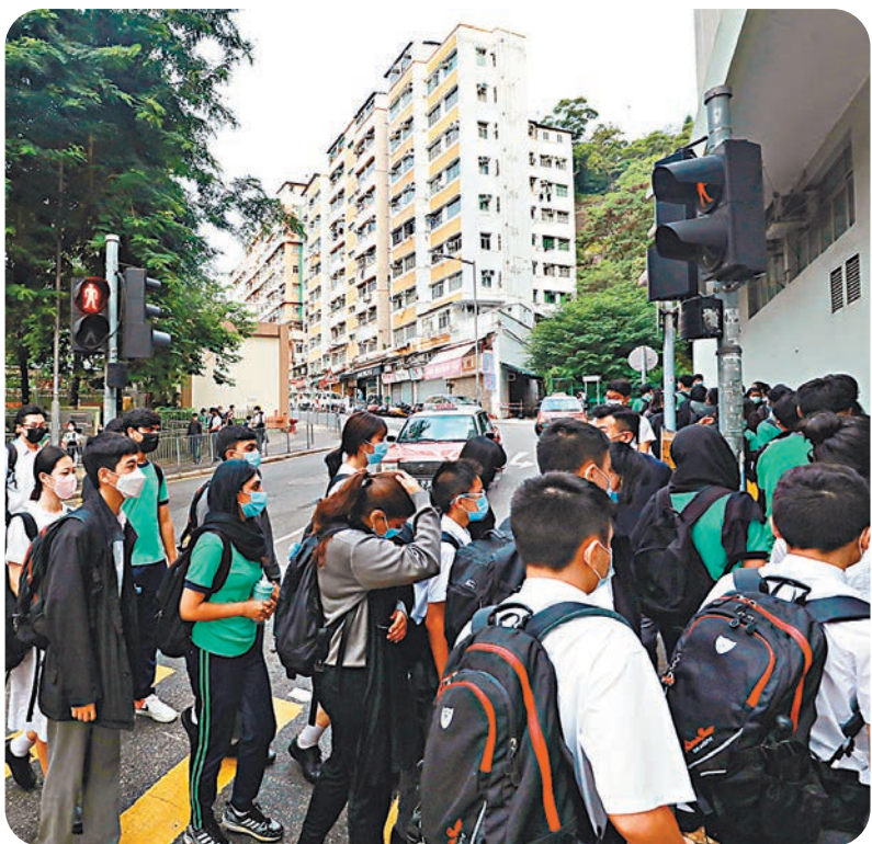
●教育局更新指引，只要全校七成12歲至17歲學生接種一劑疫苗滿14天便可恢復全面復課。圖為地利亞修女紀念學校(協和)學生，其中六年級本週全日授課。

本港新冠肺炎疫情穩定，昨日沒有輸入及本地個案，為半個月內第二度「雙零確診」。因應專家建議12歲至17歲青少年只需接種一劑復必泰疫苗，教育局昨日致函全港學校，更新恢復全日面授課堂及相關活動的門檻要求，只要全校七成12歲至17歲學生接種一劑疫苗滿14天便可恢復全面復課，18歲或以上學生及教職員則仍須接種兩劑疫苗。有中學校長指修訂復課條件後，學生毋須多等一個月打第二針，學校可提早全面復課。有校長則估計，在新指標下，10月全港約有十分之一中學有機會開始讓高年級全日復課，全港學校也將陸續恢復正常。